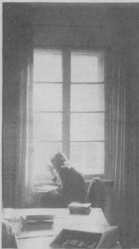
K svetlobi — Hvastija