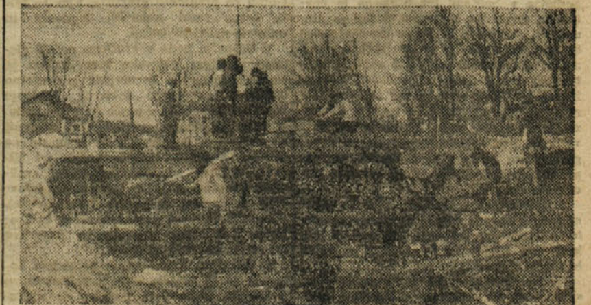
Gradnja mostu čez že regulirani del potoka Koren

V okviru praznika OF je bila v novem prostoru ob otvoritvi prosvetna predstava, ki so jo organizirali AFZ in pionirji, avtobus pa je 10. maja nastopil svojo prvo pot z Vrat proti Gorici.