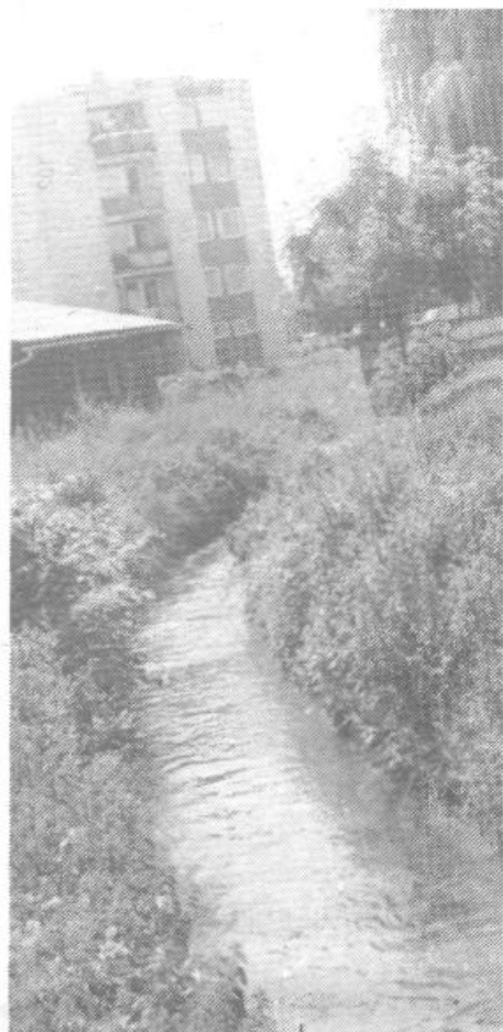
Delavci TOZD Hidrogradnje bodo očistili in obnovili strugo Gradašče