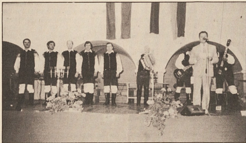
Ansambel Lojze Slak je privabil nad 1500 gledalcev!