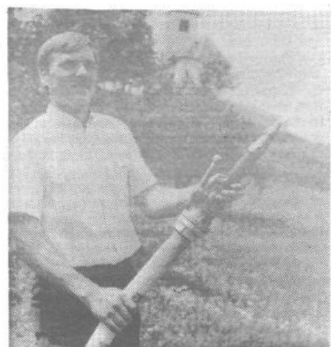
Prvi curki vode na Koreni