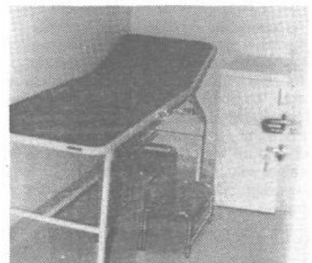
Pogled na del nove ambulante na Igu