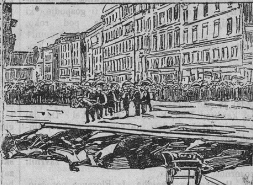
Der Platz St. Philippe du Roule, auf welchem 5 Personen umkamen.

Schauplätze der Wetterkatastrophe in Paris.