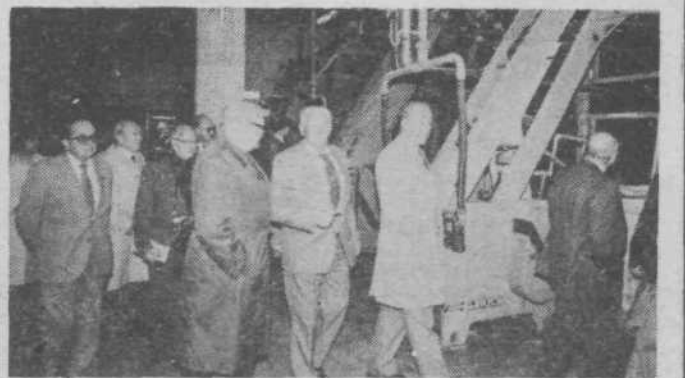
Španski borci so si na obisku v vevski papirnici ogledali tudi proizvodne prostore.

Zadnji dan so se španski borci ogledali gradnjo PST in vevsko papirnico kot pomembno organizacijo boja za delavske pravice že pred vojno, vojaško gimnazijo Franc Rozman-Stane, vojašnico Bratstva in enotnosti in Cankarjev dom. Tridnevni obisk je prehitro minil v tovariškem, prijateljskem ozračju. Nadvse zadovoljni so se španski borci poslovili od nas. AM - JK