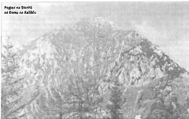
Pogled na Storžič od Doma na Kališču