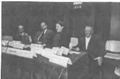
Utrinek s soočenja kandidatov za poslance v Trzinu

govanje potekalo, še preden so se sploh pojavile trgovine in kasneje veleblagovnice, kaj šele veliki neosebni nakupovalni centri, katerim vlada neznanska naglica. Nasprotno pa so tržnice kraj, kjer življenje poteka počasi, ljudje se sprehajajo od ene stojnice do druge, si ogledujejo pisano sadje in zelenjavo, ki je zanimivo tudi za otroške očke, starši pa, medtem ko njihovi otroci pridno gladajo pravkar kupljeno žemljico, primerjajo cene ter nakupujejo zelenjavo za kosilo, za vlaganje... Babice in dedki se prav tako kot ostali, ali pa še rajši, spustijo v kakšen sproščen in zabaven, včasih celo poučen pogovor. Na primer o tem, kako koristna in hranljiva je lahko oranžna buča hokaido in kako enostavno jo je pri-