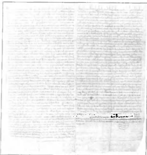
Listina, v kateri se pojavi prva pisna omemba Mengša.

Ponovno pa se nam lahko pridružite na filmskih večerih in filmskem maratonu, ki bo, tako kot vedno, pester, tematski in navdve zanimiv. Ne pozabite podaljšati tudi članstva v študentskem klubu – vse podatke najdete na www.studentski-klub.com .