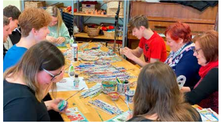
Projektne dnevi Ustvarjajmo skupaj.

V mesecu maju 2022 se je osem dijakov udeležilo Vzgojiteljade, ki je potekala v Jesenicah, kjer so se udeležili različnih delavnic, pomembnih za poklic vzgojitelja/vzgojiteljice, ter se povezovali z drugimi srednjimi šolami, ki izvajajo program predšolske vzgoje. Skozi celo leto potekajo že ustaljene medpredmetne povezave, s katerimi pripravljamo zanimive in unikatne izdelke ter storitve, kot so izvirne slikanice, pesmarice, stop animacije, filmčki, delavnice in predstave za otroke.