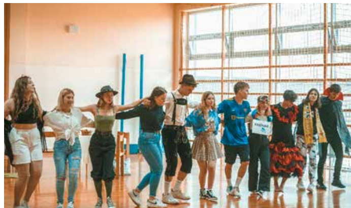
Prireditev ob dnevu Evrope.

Dijaki so bili zelo dejavni tudi v projektu EPAS, Šola ambasadorka Evropskega parlamenta. Dokazali so, da je mladim še kako mar za našo prihodnost in da se zavedajo, da je nacionalna in evropska politika del našega vsakdana. Skozi celotno šolsko leto so iskali rešitve številnih družbenih izzivov, razpravljali z evropskimi poslanci, obiskali Hišo EU v Ljubljani, sodelovali na različnih delavnicah preko Mladinskega centra Ormož, osveščali lokalno skupnost o pomenu Evropske unije.