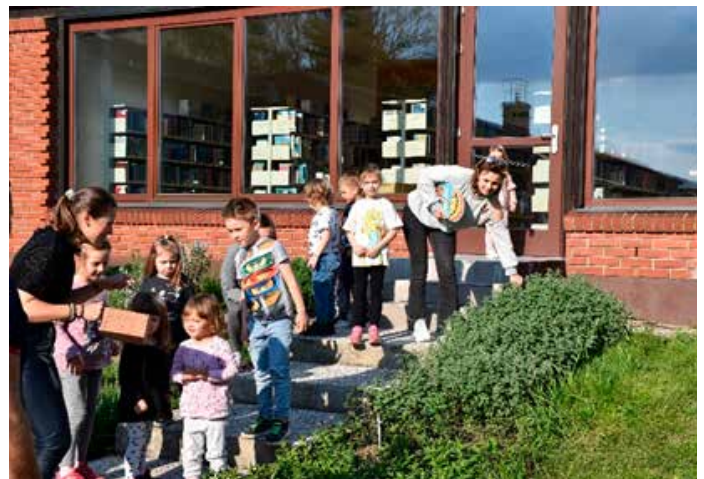
Knjižnica znova polna pravljinih trenutkov in mladih obiskovalcev.