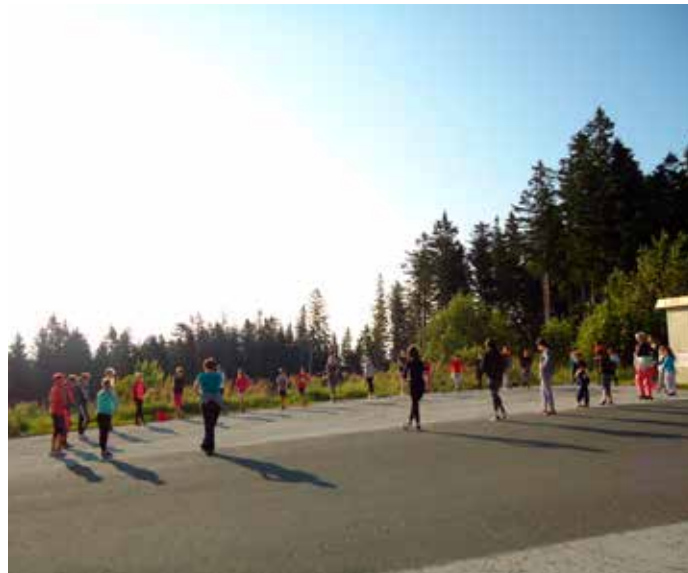
Fotografija: Jutranja telovadba na Pohorju, 2018.

Ker se bližajo poletne počitnice, tečejo priprave za izvedbo dveh taborov: otroškega raziskovalnega tabora, ki bo potekal med 4. in 8. julijem ter letos nosi naslov Poletje v Ormoških lagunah, in otroškega počitniškega tabora na Treh kraljih, ki bo potekal v času med 25. in 30. julijem 2022.