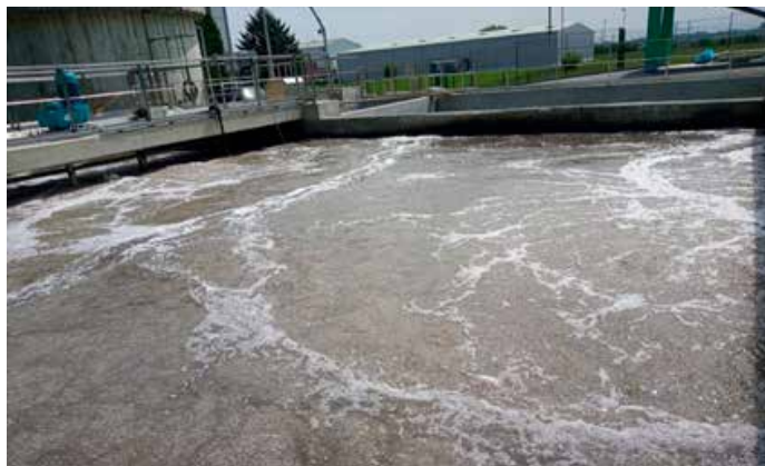
Čistilni bazen z vpihovanjem zraka, v katerem so PVA čistilni delci.

D ela na rekonstruirani čistilni napravi so v zaključni fazi. Vgrajena je vsa tehnološka oprema, zaključuje se tudi urejanje okolice, vključno z asfaltiranjem površin. Dela, ki so bila začeta v mesecu januarju 2021 na prostoru nekdanje tovarne sladkorja, so zajemala izvedbo projekta rekonstrukcije in