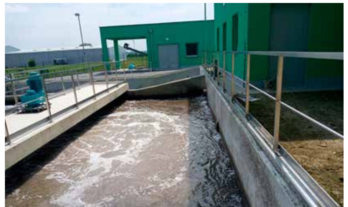
Odpadna voda, ki se po postopku NBBR (premikajočo se biomaso), prečiščuje.