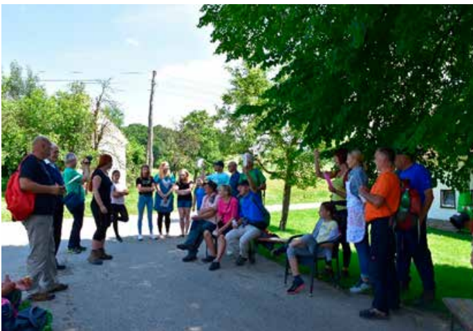
Utrinek z lanskoletnega pohoda po poteh kulturnih buditeljev.

Razlogov za obisk knjižnice je torej več kot dovolj – ob vsem zanimivem, kar se je in se še bo pripravilo za vas, bo pa verjetno zmanjkalo le prostih dni na vaših koledarjih.