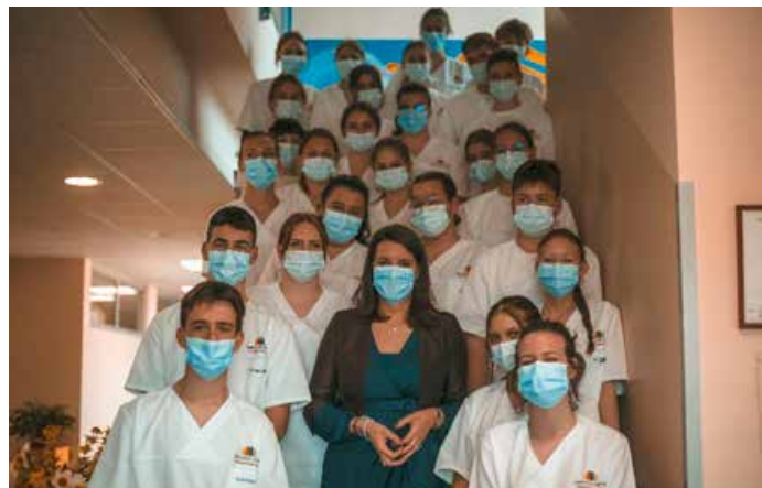
Obisk ministrice za šolstvo dr. Simone Kustec.

V naslednjem šolskem letu načrtujemo obisk zdravstvenih ustanov v sosednji Avstriji in na Hrvaškem, da bodo imeli dijaki možnost spoznati različne zdravstvene sisteme in okrepiti svoje jezikovne kompetence.