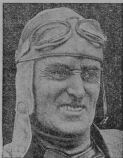
Anglež Malcolm Campbell je dosegel z avtomobilom hitrostni rekord 445 km na uro.

Po tibetanskih planotah v osrednji Aziji je opaziti po vodovju in močvirju zelo razvito živalsko življenje. Dobiti