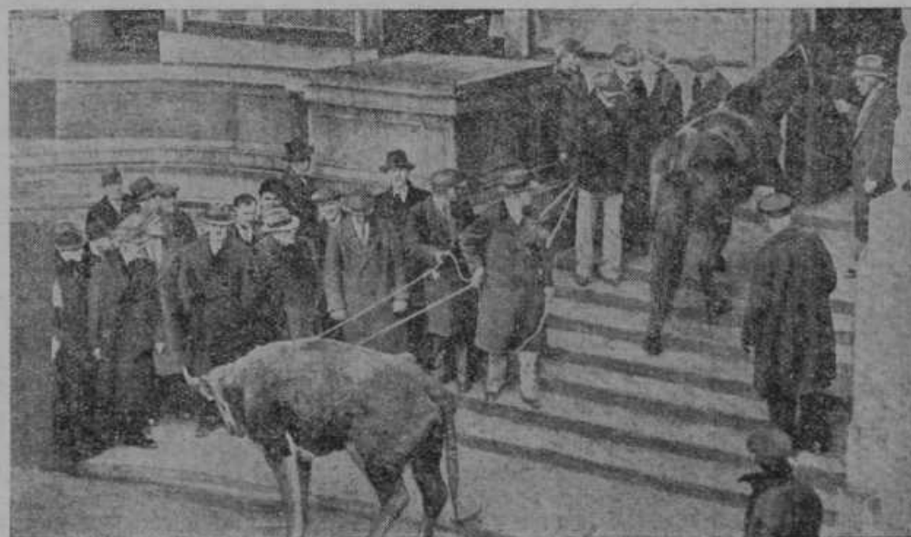
Amerikanci si znajo pomagati. Lanska suša je povzročila v ameriških Združenih državah strahovito škodo. Vsled suše je največ trpela živina. V St. Paulu, prestolici države Minnesota, so prosili kmetje za državno pomoč. Ker pomoči ni bilo, so prignali pred vladno palačo sestradano živino, ki je mukala tako dolgo, dokler niso prejeli kmetje pol milijona dolarjev državne podpore.