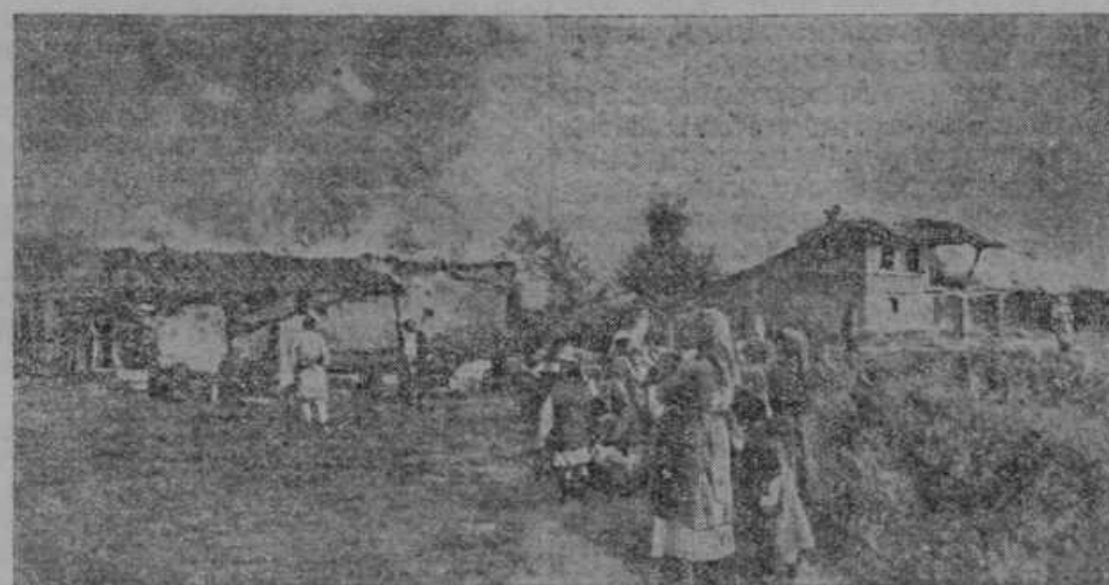
Žalostna slika revolucije na Grškem. Po topniškem ognju porušena vas pri Seresu.