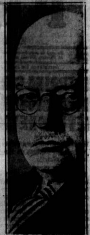
Dr. Hans Luther, bivši predsednik državne banke v Nemčiji.

Primer proračun predvideva 1562 odjemalcev v rezidenčnih stanovanjih, ki imajo skupno 8239 sob ali povprečno pet in eno četrtino sobe na hišo.