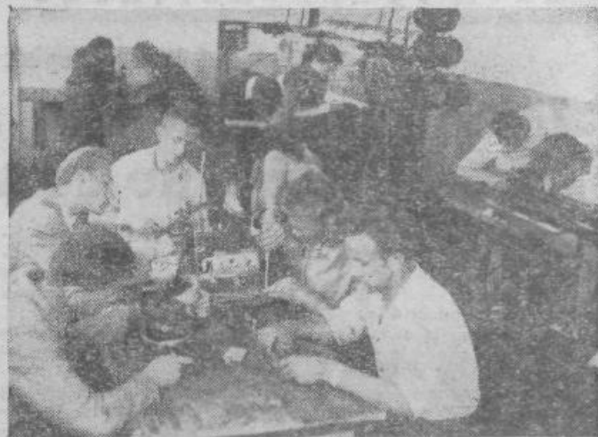
Učenci industrijske šole v Leskovcu