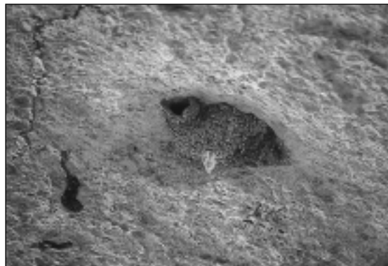
Slika 2: Gnezdo rdeče lastovke v steni pod Velim Badinom, 31.8.2000