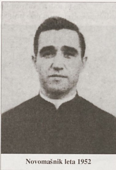
Novomašnik leta 1952

„Prvo noč sem jokal, ko sem si ogledal zanemarjeno in zapuščeno cerkev, brez vsake opreme, brez zadostnih mašnih