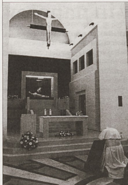
Papež moli na grobu bl. Georga Prece

Prebivalce „bisera“ Sredozemlja, ki meri komaj 316 kvadratnih kilometrov, je povabil: „Dragi prijatelji Maltežani, veselite se vaše krščanske poklicanosti! Bodite ponosni na kulturno in versko dediščino! V prihodnost zrite z zaupanjem in si s prenovljeno močjo prizadevajte, da bi iz novega stoletja naredili čas solidarnosti in miru, ljubezni do življenja