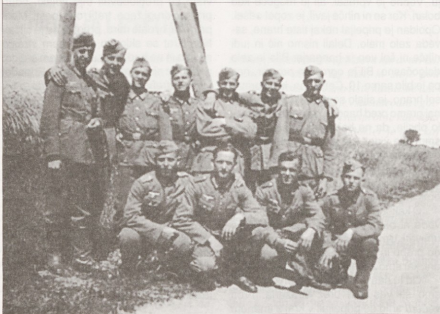
Skupina Gorenjcev, mobiliziranih v nemško vojsko, junija 1943.

Naslednje jutro smo dobili malo trdega kruha in črno grenko kavo. Zopet so nas zbrali skupaj in smo šli na pot z istimi stražarji in konji. Sredi popoldneva smo prišli v Vannes. Tam nas je pričakala večja skupina civilistov. V glavnem so bile ženske. V tem kraju so letele na nas