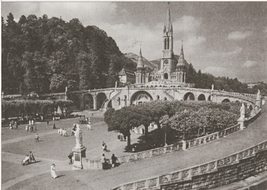
Lurd v Franciji

Vsak dan v duhu poromam v bolnišnice in zdravilišča, kjer žive ljudje vseh starosti in vseh socialnih slojev. Predvsem bi se rad ustavil ob bolnikih, njihovih svojcih in zdravstvenih delavcih. Ti kraji so nekakšna svetišča, kjer so ljudje deležni Kristusove velikonočne skrivnosti. Tudi najbolj raztreseni se tam sprašujejo o lastnem bivanju in njegovem pomenu, o pomenu zla, trpljenja in smrti. ... Le kako ne bi nujno pozval medicinskih strokovnjakov in njihovih pomočnikov, da se od Kristusa, zdravnika duš in teles, nauče biti resnični 'usmiljeni Samarijani'? Kako ne bi želel tistim, ki se neposredno posvečajo negi bolnikov, naj bodo vedno pozorni na potrebe trpečega človeka in naj združujejo v svojem poklicu usposobljenost in človečnost? Bolnišnice, domovi za bolne in ostarele ter vse hiše, ki sprejemajo trpeče, so prednostna okolja nove evangelizacije, ki se mora truditi, da prav v njih zazveni upanje, prinašajoče evangeljsko sporočilo. Samo Jezus, Božji Samarijan, je za vsako človeško bitje, ki išče mir in odrešenje, pomirljiv odgovor na najgloblja pričakovanja. Zato ga Cer-