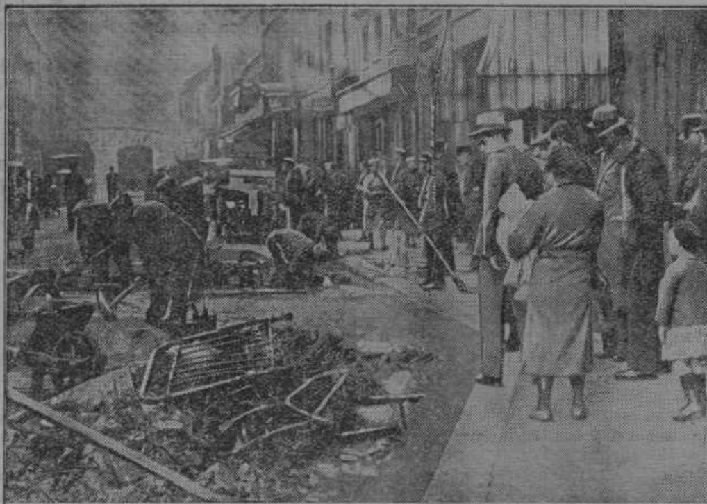
Po majalških komunističnih nemirih v Parizu.

Sedaj si lahko predstavljam, kako veliko škodo napravi elementarna sila ognja na našem imetju in premoženju. Previden gospodar bo zato zavaro-