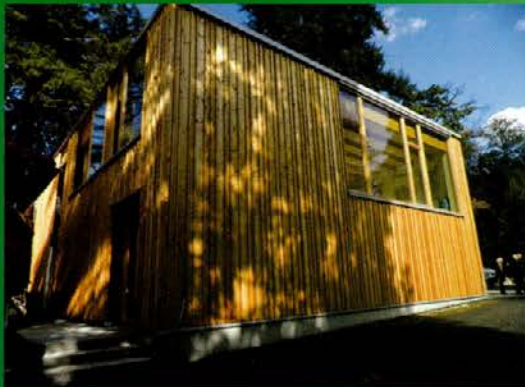
Trgovsko-poslovni objekt Radlje ob Dravi

Udeležba in razgovori z udeleženci na posvetu so pokazali, da si slušatelji želijo še več podobnih predstavitev o uporabi lesa kot gradbenega materiala in njegovih zmoglostih v graditeljstvu.