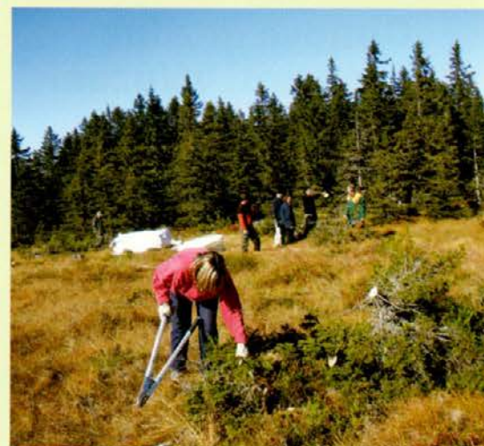
Čiščenje zarasti na mokrišču na Mulejevem vrhu

Povojne selitve lokalnega prebivalstva v doline so pomenile opustitev tradicionalnega načina izrabe naravnih virov in prekinitvev značilne samooskrbe kmetij in gozdarskih naselij. Z opuščanjem košnje in paše so se pohorska travišča pričela intenzivno zaraščati. Projektna naloga Zaraščanje negozdnih površin na grebenu Pohorja, ki jo je leta 1995 izdelal Zavod za gozdove Slovenije, OE Slovenj Gradec (Mika Medved), je bila osnova za ukrepanje na tem področju. V skladu z usmeritvami omenjene naloge so mislinjski gozdarji takoj pričeli z načrtovanjem in izvajanjem ukrepov ohranjanja planj na Pohorju. Problem zaraščanja negozdnih površin v višjih legah so zaznali tudi udeleženci delavnice Uršlja gora med preteklostjo in prihodnostjo, ki jo je leta 2008 organiziral Zavod za gozdove Slovenije, OE Slovenj Gradec, v sodelovanju z Zavodom RS za varstvo narave, OE Maribor. Prostovoljne akcije, ki je temu sledila, se je udeležilo preko 70 lovcev, gozdarjev, planincev in naravovarstvenikov, o čemer smo poročali tudi v tej reviji.