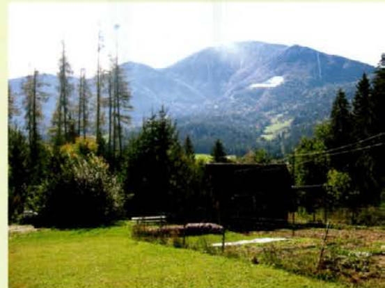
Do Ošvenovega travnika zasnežena Uršlja gora (9. 10. 2011)