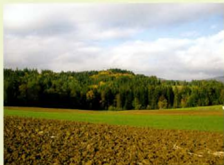
Jesensko obarvan sestoj rdečega hrasta na Navrškem vrhu (24. 10. 2011)

Korošice in Korošci smo uživali toploto sonca v oktobru ves prvi teden. Hladna vlažna fronta je 7. oktobra prekinila obdobje lepega vremena. Ta dan se je ohladilo, v jutranjih urah je pričelo deževati, v višjih predelih pa snežiti. Sneg je pobelil pobočja do nadmorske višine 600 m, v višjih predelih ga je zapadlo celo do 40 m. Na Rogli so 8. oktobra odprli smučarsko tekaško sezono. Nad 1000 m se je sneg obdržal več dni. Ta sneg ni povzročil večjih snegolomov. Drugi oktobrski teden je prevladovalo oblačno do delno oblačno vreme s kratkotrajnimi delnimi vložki jasnine. Brez težav smo lahko opravljali jesenska dela v gozdu in izven njega tudi tretji teden v oktobru, ki je bil zelo lep tudi v dolini. Do vremenskega zasuka je prišlo 20. oktobra, ko je okoli 1. ure pričelo močno deževati, nad 900 m snežiti. V dopoldanskih urah se je sneg spustil do nižin, snežilo je vse do večernih ur. Moker