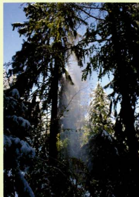
Zasnežene smreke v Pahernikovemu gozdu na Pohorju (20. 10. 2011)