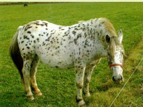
Pogled pritegnejo lepi konji