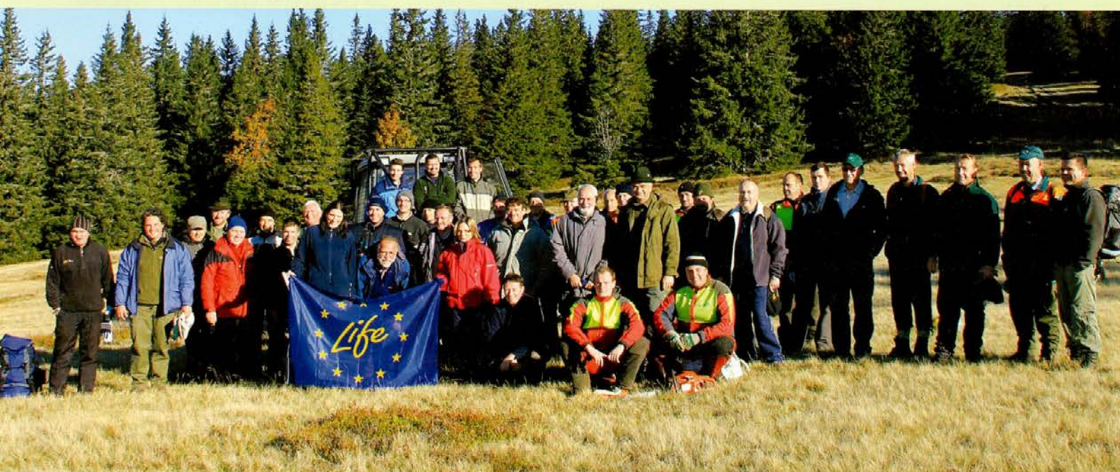
Družina gozdarjev, lovcev in predstavnikov Zavoda za varstvo narave ter lokalnih skupnosti po opravljenem delu

UNIOR, d. d. - Program turizem, Občina Mislinja, Občina Zreče in Sklad za ohranjanje narave Pohorje, se je udeležilo preko 40 prostovoljcev. Cilj naravovarstvene akcije je bil izboljšati kakovost in obseg travišč – planj, izboljšati lastnosti življenjskega prostora številnim vrstam ptic, omogočiti ekstenzivno