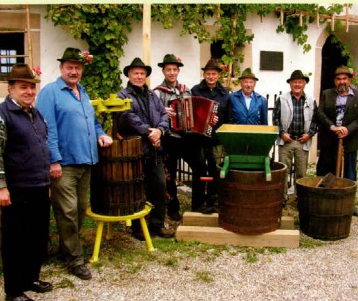
Brači pred začetkom trgatve