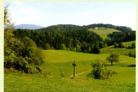
Na Poti Rimljanov in planinski transverzali na Selah

Jesensko gozdarsko obarvane aktivnosti, ki so jih izvajali gozdarji javne gozdarske službe, so bile v oktobru zelo pestre tako v