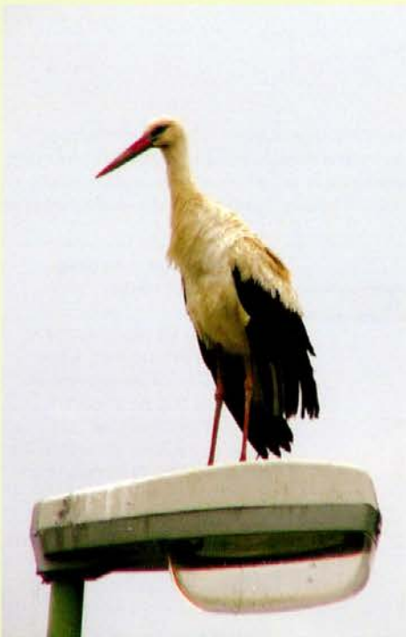
»Izvidnica« na ulični svetilki v Mislinji

Če se bodo pojavljale tudi v prihodnjih letih, bomo z zanimanjem spremljali, ali se bo pojavilo tudi značilno gnezdo na dimniku, strešnem slemenu ali električnem oziroma telefonskem drogu.