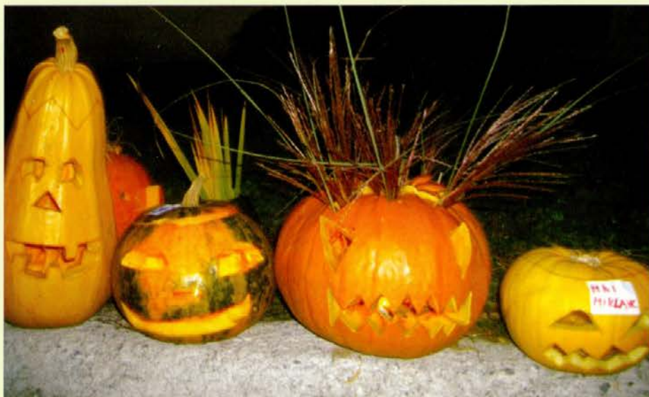
Take in drugačne ...