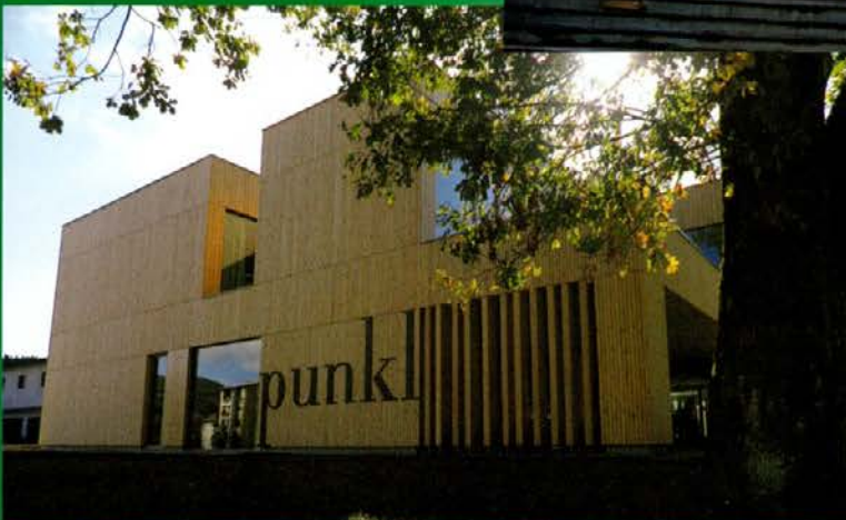
Mladinski hotel Punkl Ravne na Koroškem