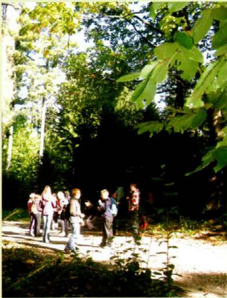
Sedmošolci OŠ Koroški jeklarji z Raven na Koroškem na GUP Navrški vrh