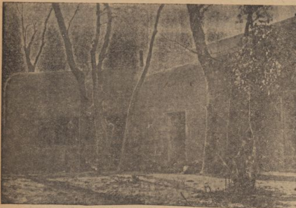
OT-Kriegsberichter Wipfler-Atl. (Wb.)