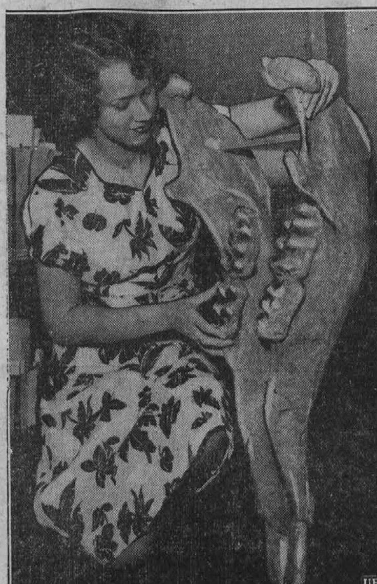
Čeljust prehistorične živali, katero so izkopali v okraju Contra Costa v Kaliforniji. Poglejte samo zobovje tega velikana.