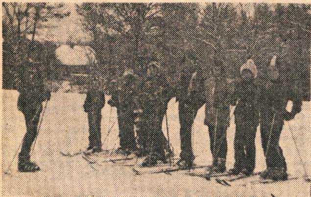
S smučarskega tečaja