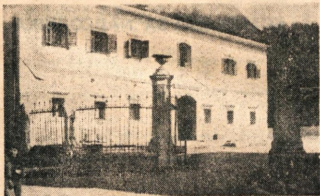
Prašnikarjev dvorec v Mekinjah

Kulturna komisija pri OO ZSM Komenda je v počastitev Prešernovega dne pripravila zborni recitaciji Krsta pri Savici. Maloštevilna udeležba nam je še enkrat prikazala odnos krajanov do tovrstnih prireditev, pa tudi do dijakov in študentov, ki so prebili marsikatero uro na vajah v nezakurjenih prostorih, potem pa recitirali prazni dvorani. Marsikomu izmed nas se je upravičeno porodilo vprašanje, čemu organizirati proslave, ki so vse bolj in bolj le same sebi namen. DANICA GROSELJ