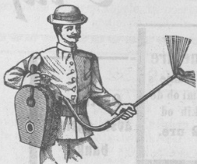
Zastopniki se iščejo!

Trijerji (čistilni stroji za žito) v natančni izvršitvi.