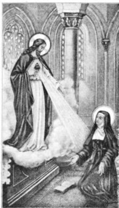
Jezus pokázse szvoje szv. szrce bl. Margeti Ai.