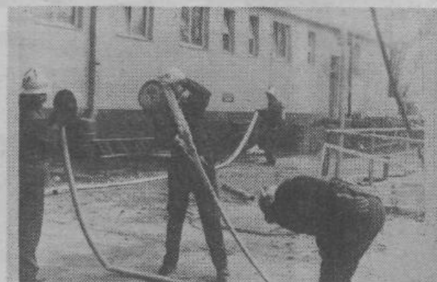
Vodne cevi morajo biti vedno ustrezno zložene

Opozoriti pa velja, da so bile tudi tokrat tovarniške transportne poti preveč zatrpane in večja gasilska vozila bi ob resničnem požaru ne bi prišla do tja, kamor bi morala priti. V. J.