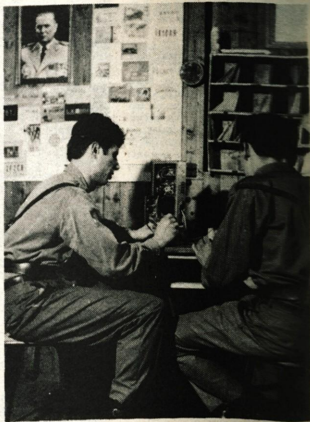
Veliko vezistov v prostem času sodeluje v dejavnosti radioamaterskega kluba 22. december