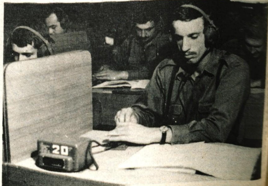
Radiotelegrafisti med poukom spoznava-jo aktivnosti Morsejevih znakov.