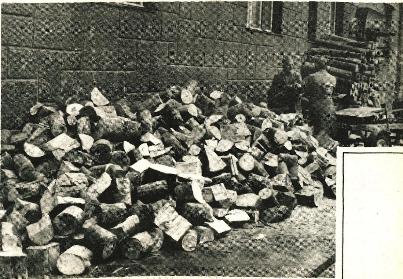
Vse dražja nafta dviga tudi vrednost drv, na katera smo zadnja leta že kar pozabljali, sedaj pa bodo marsikje spet ogrela kamine in druge peči na trda goriva.