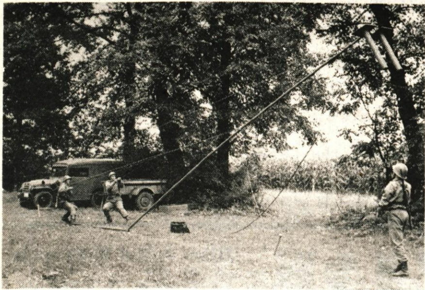
Od postavitve antene je odvisna uspešnost delovanja naprave za radijsko-relejne zveze