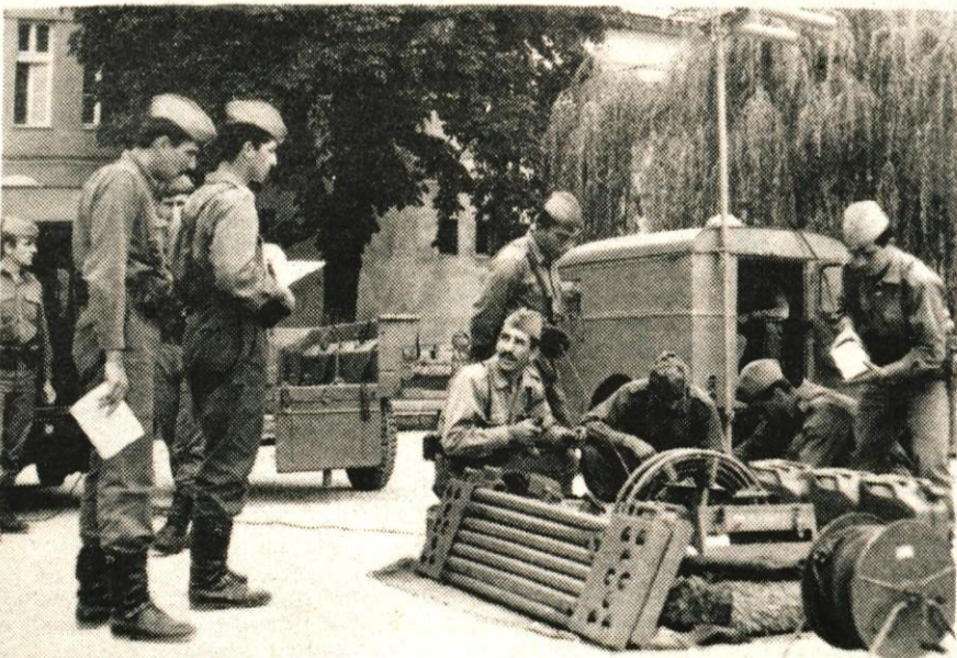
Pregled naprav za zveze pred odhodom na urjenje