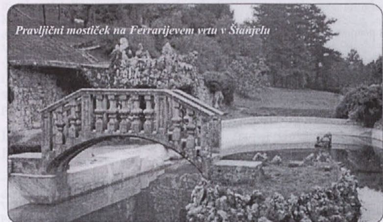
Pravljni mostiček na Ferrarijevem vrtu v Štanjelu

vrste, saj je znano, da tudi na tem področju ni pretiranega sodelovanja. Kras je lep in zanimiv v vseh letnih časih, zlasti tudi v jeseni, ko tam zori grozdje trte refošk iz katerega pridelajo odlični teran. Sicer pa se v Mipovi pršutarni v Kobjeglavi lepo suši pršut. V Pršutarni imajo tudi prostor za sprejem gostov in poslovnih partnerjev ter tudi neposredno prodajo pršuta, ki je v primejavi z nakupom v trgovini