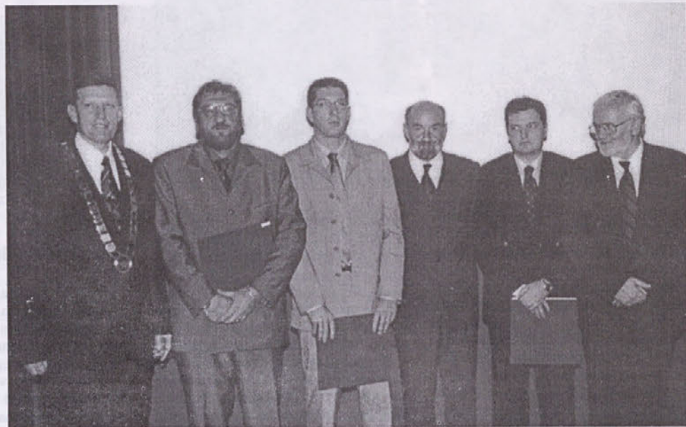
Na sliki: Prvi magistri Fakultete za pomorstvo in promet Portorož