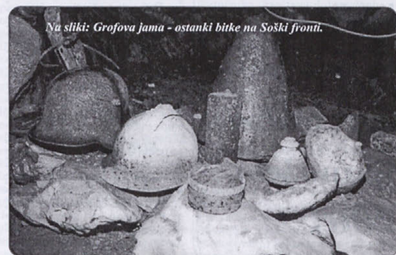
Na sliki: Grofova jama - ostanke bitke na Soški fronti.

letno delovanje te znane mesno predelovalne industrije, njihov odnos in skrb za tržišče, kupce ter okolje. Številni njihovi izdelki so znani pod skupnimi blagovnimi znamkami Kastelan, Alpika, Kraljica mortadela Gorica in drugo. V Mipovih pršutarnah dozori letno kar 150.000 pršutov, samo v Kobjeglavi 50 do 60 tisoč. Sveže stegno ima okrog 9 kg, suhi pršut pa povprečno 6 kg. Kar