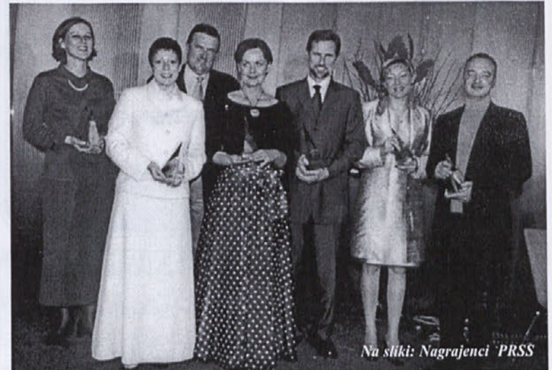
Na sliki: Nagrajenci PRSS

Nagrada za vzpostavljane slovenskih strokovnih organizacij in njihovo mednarodno uveljavitev je prejel