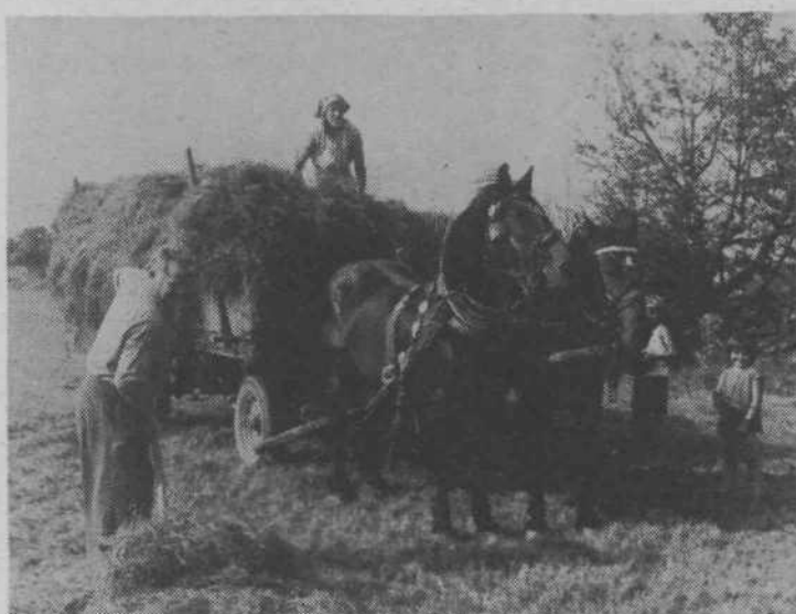
Družina Pečar (cesta v Zajčjo dobrovo) je „vpregla“ vse moči pri pospravljanju sena s travnikov, ki so v letošnjem letu vse prevečkrat mokri. Za razgovor niso imeli časa.