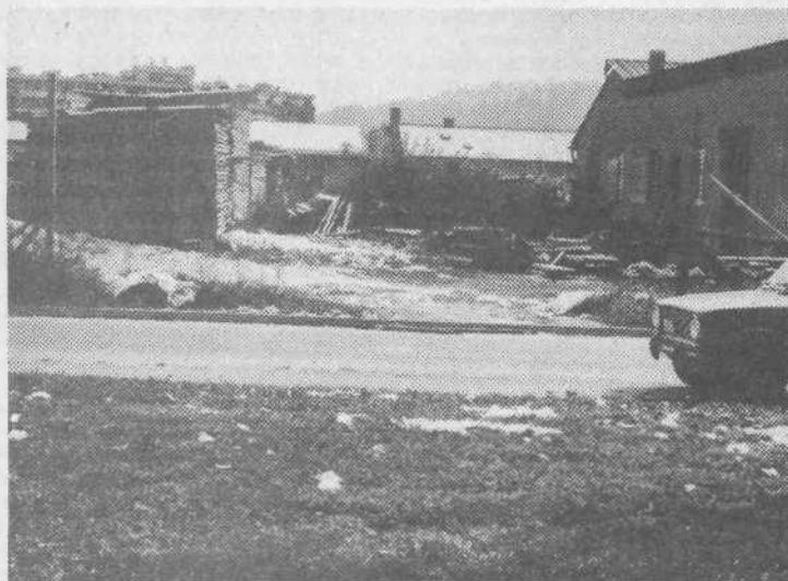
DO Uslugi so pošli apetiti po gradnji kar mini industrijske cone v Kosezah. Kolikor vemo tudi v občini Moste-Polje niso bili najbolje sprejeti. Kako bi tudi bili, saj so že v naši občini zapustili očitno sled.