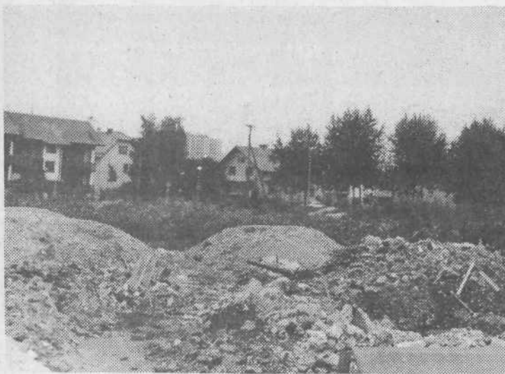
Kje so tiste stezice, kjer so včasih bile ... Tako se sprašujejo mnogi krajanji Kosez ob grmičevju, kupih gradbenega materiala in druge navlake na prostoru, kjer naj bi bila že tako opevana tržnica.