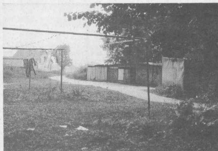
Stanovalci Vizjaka, kot pravijo v Medvodah samskemu domu tovarne Celuloze, v njem pa imajo stanovanja tudi delavci Colorja in Donita, ne čakajo na projektante, ki že dve leti mečkajo z zazidalnim načrtom Medvod. Lastnoročno so se lotili projektiranja, izdelave načrtov in realizacije garaž. Le kaj bi čakali na strokovnjake, saj lahko sami poskrbijo za okras kraja.