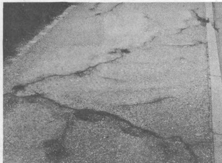
Pločnik ob Podutiški cesti. O kakovosti naših cest pač ne bi izgubljali preveč besed. A eno je gotovo, če že nimamo denarja za gradnjo novih, bi vsaj za redno vzdrževanje lahko bolje poskrbeli.