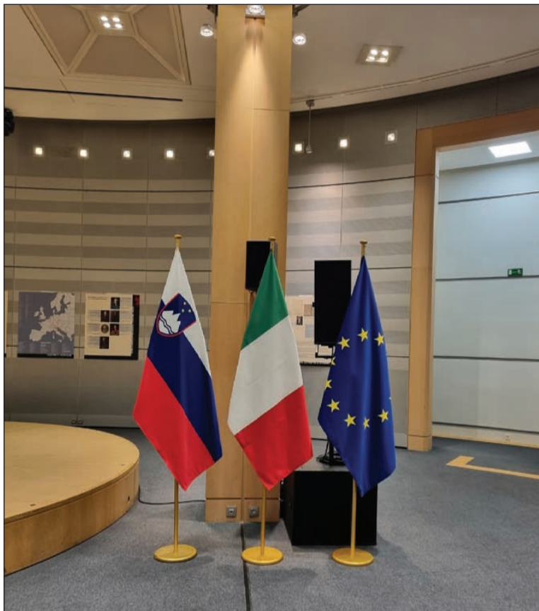
Fig. 4: Disposizione delle bandiere alla mostra "Il Maestro delle Nazioni" al Parlamento europeo a Bruxelles (29 novembre 2022).