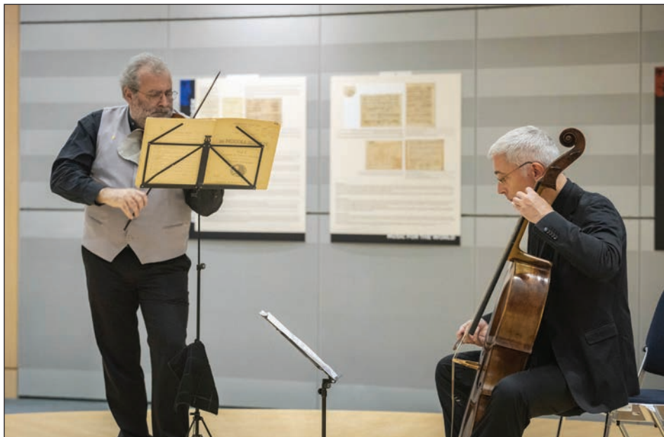
Fig. 5: Concerto d'apertura della mostra "Il Maestro delle Nazioni" al Parlamento europeo a Bruxelles (29 novembre 2022).

hanno espresso un grado di disaccordo maggiore sul fatto che tutti coloro che vivono in Slovenia dovrebbero farsi promotori di Tartini (come prodotto culturale), mentre c'è soltanto un leggero grado di accordo sul fatto che il Ministero degli Affari Esteri dovrebbe fare qualcosa per promuovere Tartini.