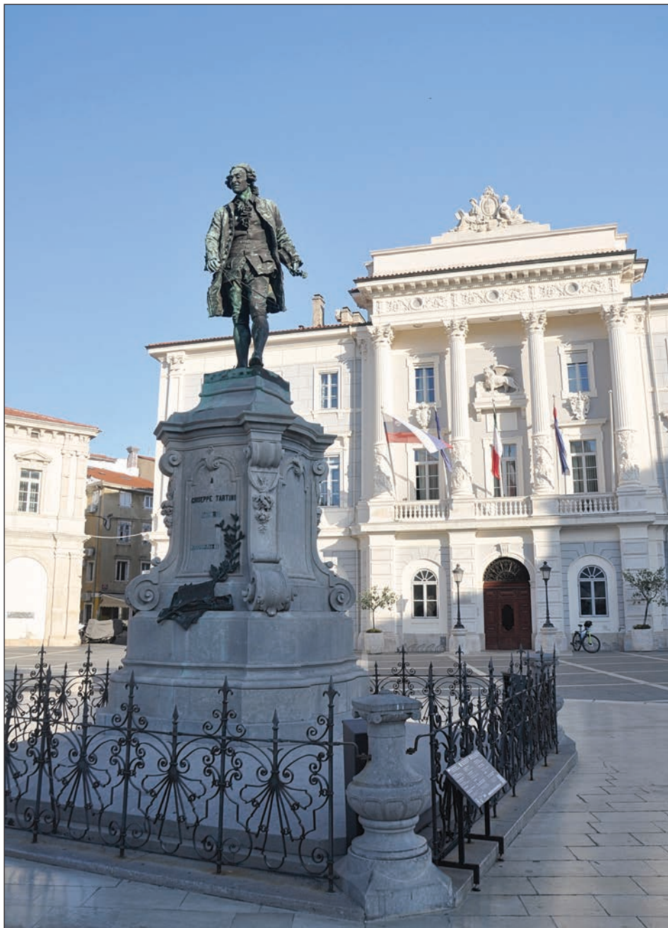
Fig. 2: Monumento a Giuseppe Tartini a Pirano (Lara Sorgo, 2022).