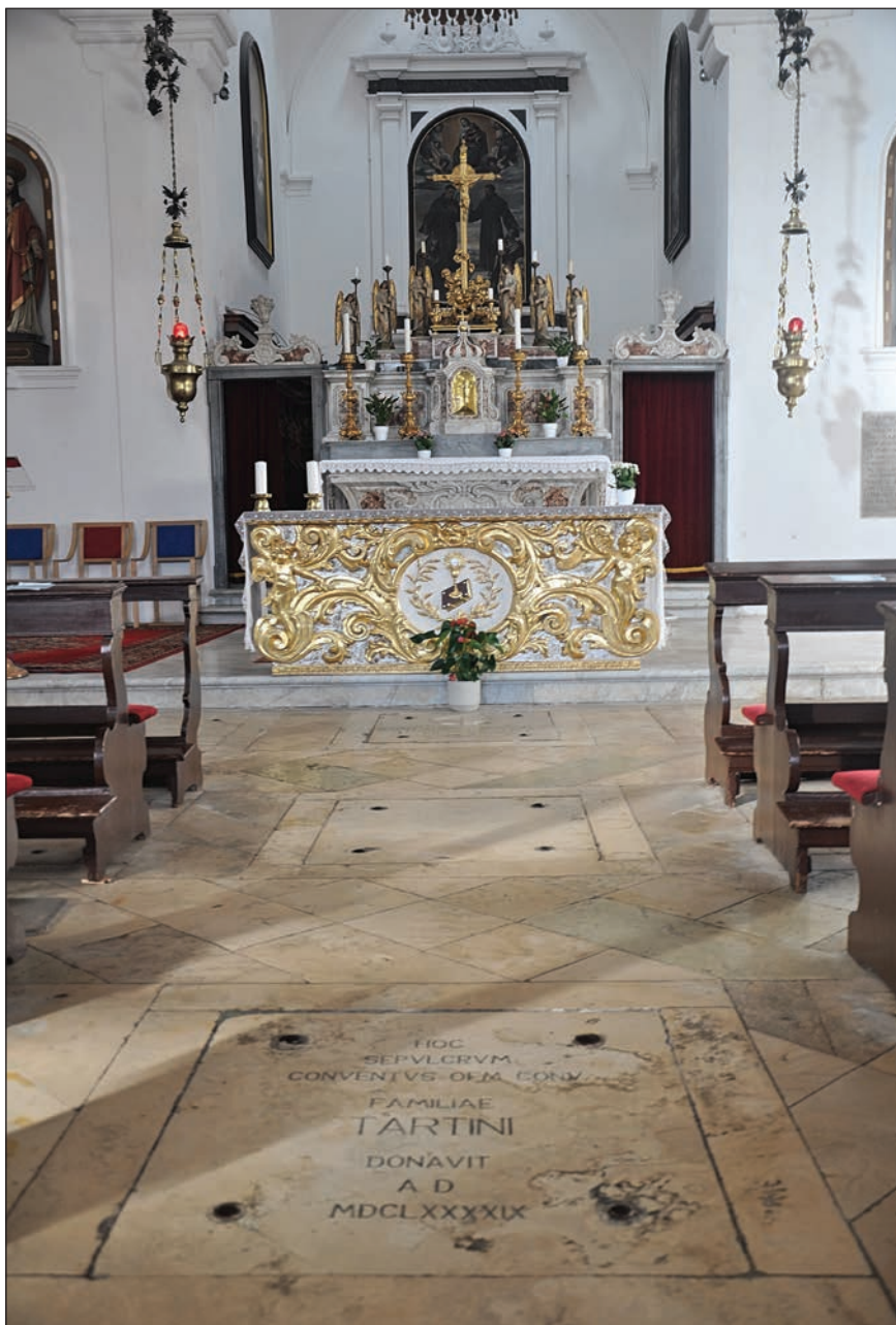
Fig. 3: La tomba della famiglia Tartini nella chiesa di San Francesco a Pirano (Convento dei Frati minori conventuali di San Francesco) (Lara Sorgo, 2022).