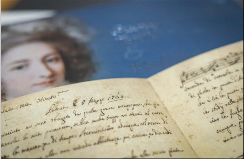
Fig. 6: Dettaglio della mostra "Il Maestro delle Nazioni" al Parlamento europeo a Bruxelles (29 novembre 2022).