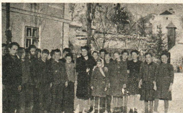
Pred šolo z nemško učiteljico