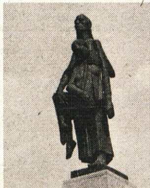
Spomenik v Ravensbrücku

Na meji med Zvezno republiko Nemčijo in češkoslovaško leži mesto Flossenburg, kjer so nacisti leta 1938 ustanovili osrednje taborišče. Prvi jetniki so bili nemški in avstrijski komunisti, pozneje so prihajali sem ruski jetniki, znane politične osebnosti drugih držav in visoki nemški oficirji vermahta, obtoženi sode-