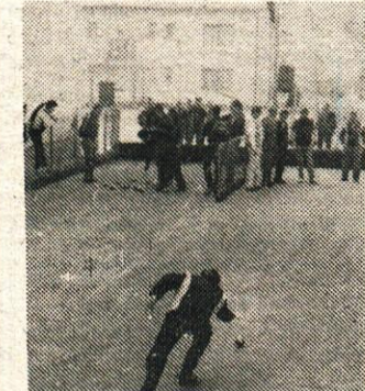
Kar 13 ekip se je pomerilo v balinanju na dvosteznem igrišču