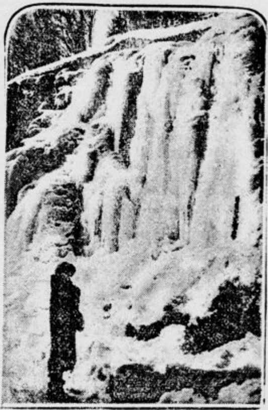
Pogosta slika v sedanjih zimskih sezonah: Zamrzel slap v bližini Chamonia v francoskih Alpah.