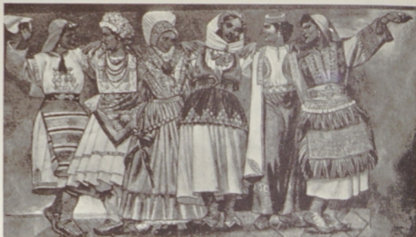
Slika z naše naslovne strani. Jugoslovanke v narodnih nošah. Vsaka posamezna predstavlja svojo republiko, od leve proti desni so: Bosanka, Hrvatica, Slovenka, Srbkinja, Črnogorka in Makedonka. Prizor je s freske akad. slikarja profesorja Slavka Pengova v aoli nove ljudske skupščine

Kljub težavam, s katerimi se še borimo in kljub dejstvu, da nas ovirajo še mnogi ostanki starega in zastarelega, se pred nami odpira perspektiva stalnega napredka in pobiljševanja življenjskih pogojev. Današnja Jugoslavija je dežela ljudskega samoupravljanja, socialistične demokracije in nacionalne enakopravnosti, dežela, ki z avtoriteto svojih uspehov pri socialistični graditvi in svoje politike neodvisnosti, privrženosti miru in prijateljskega sodelovanja z vsemi miroljubnimi narodi uživa ugled po vsem svetu. Lahko smo ponosni na delež, ki ga sodobna Jugoslavija daje v borbi za napredek človeštva in za mir med narodi.◀