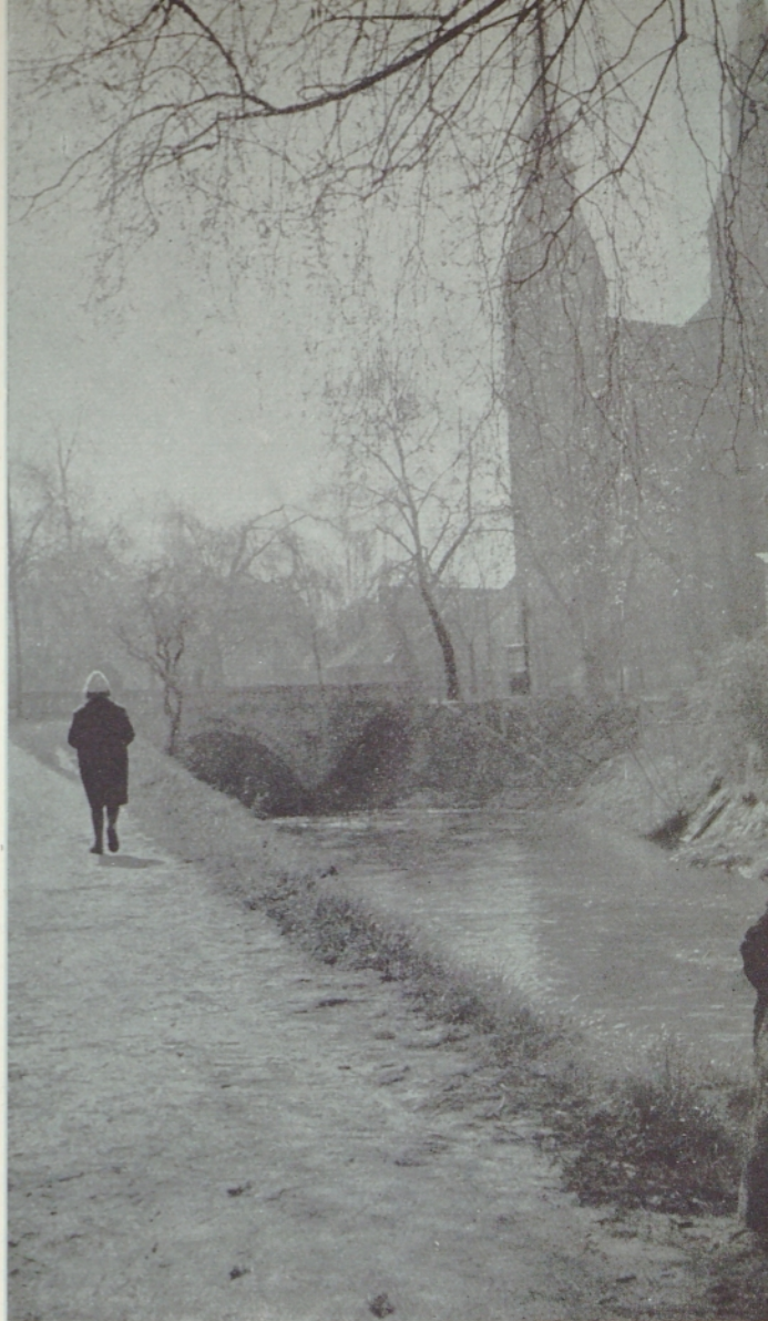
Pozna jesen ob Gradaščici. Zadaj Trnovska cerkev, kjer je pesnik Prešeren prvič srečal svojo neusojeno ljubezen — Primičevo Julijo

Lepo mirno je minilo to življenje — posvečeno delu, potem spet spominom na hčer, na Draša, na