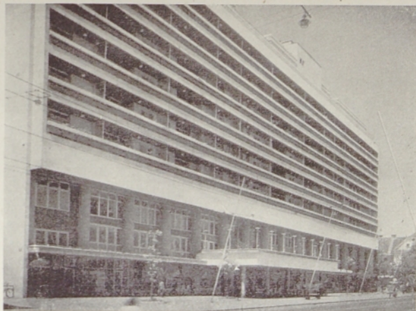
Teje moderni novi palači na Titovi cesti Ljubljančani hudomušno pravijo »kozolec«. Ali mu je res podobna?

Zelo se je povečalo tudi število zdravstvenih ustanov in ambulanz. Zgrajena je bila nova Cen-