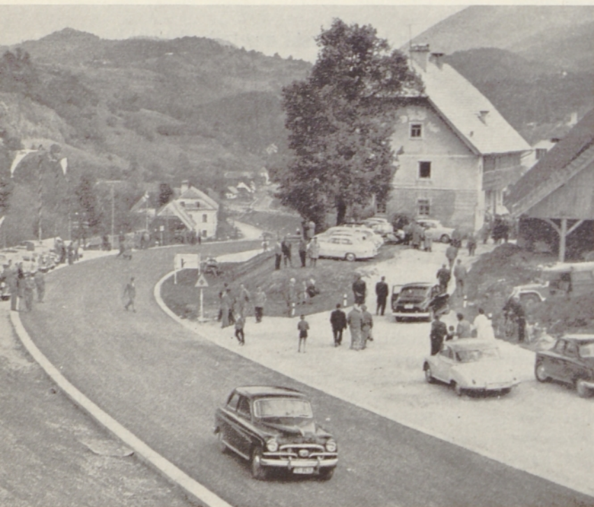
Dve sliki z otvoritve nove ceste čez Trojanski klanec

— V zadnjih sedmih letih, odkar jugoslovanska vlada dodeljuje štipendije tujim študentom, število teh interesentov stalno raste. Letos je na naših visokih šolah že okrog 500 tujih študentov iz evropskih in azijsko-afriških dežel. Mnogi študirajo pri nas tudi na lastne stroške.