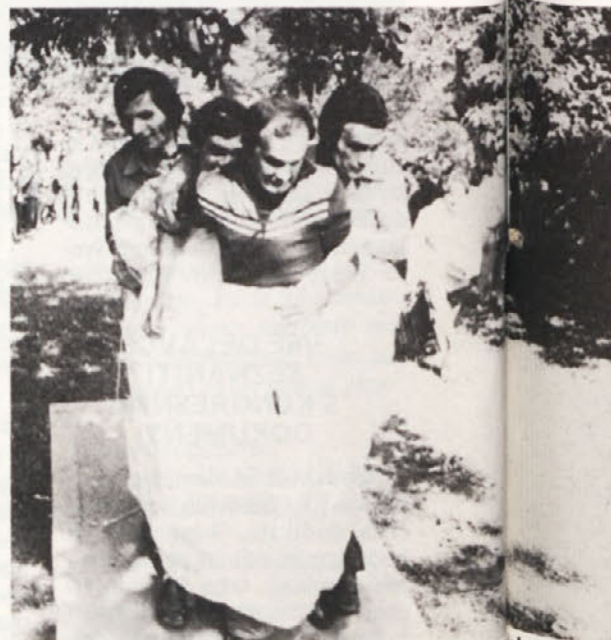
Športno šaljive igre so požele salve smeha igralci.