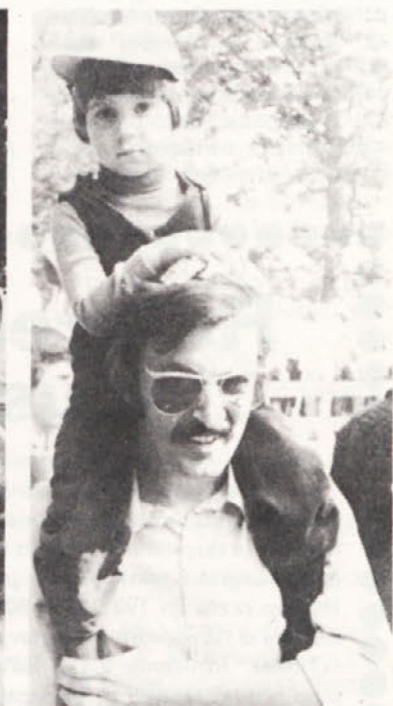
Tradicija se nadaljuje! Tudi letos so namlajši prijezdili na očkovih ramenih na Gorjance.