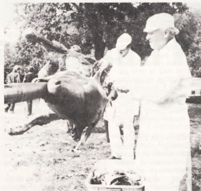
Jedci pa smo! Vola je zmanjkalo kot za šalo...