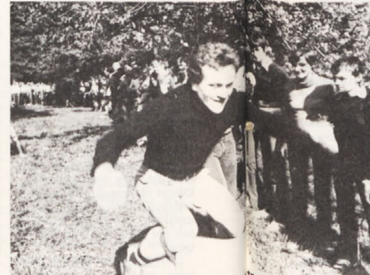
Takole pa so skakali tekmovalci športno-šaljivih iger.