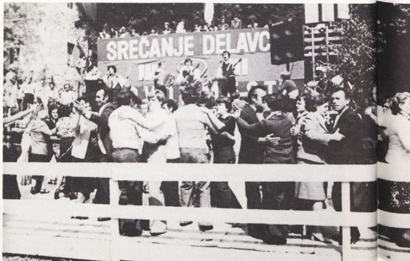
Plesišče je bilo vseskozi polno, kar dokazuje, da se znamo poveseliti.

Zdaj smo spet na svojih delovnih mestih, spet opravljamo svoje delovne dolžnosti, spet doživljamo majhne radosti in težave, spet razrešujemo vprašanja proizvodnje, poslovanja, načrtujemo našo skupno prihodnost. In ta naš vsakdanjik je prav zaradi srečanja malo drugačen kot je bil doslej. Bolj veder je, več zaupanja v prihodnost je v njem, prav zato pa ima zasluge tudi srečanje. In v tem je njegova vrednost!