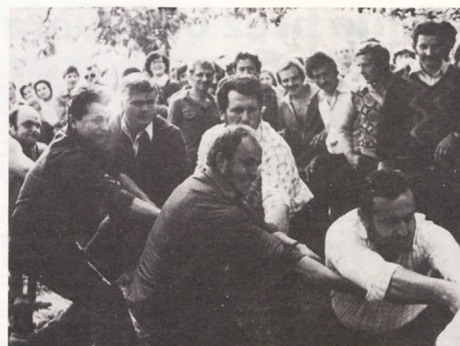
Tovarna avtomobilov premore najmočnejše možakarje v DO IMV.