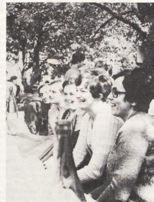
Takole se znajo zabavati Belokranjke.