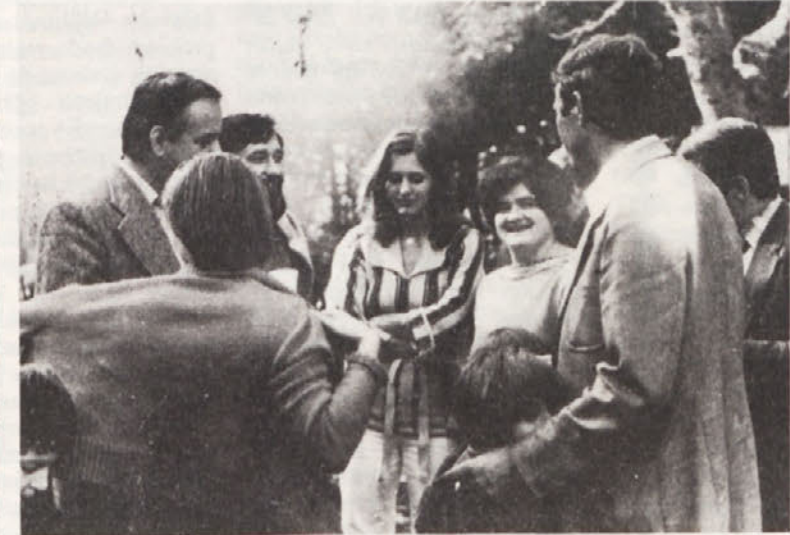
Sproščen pomenek med sodelavci.