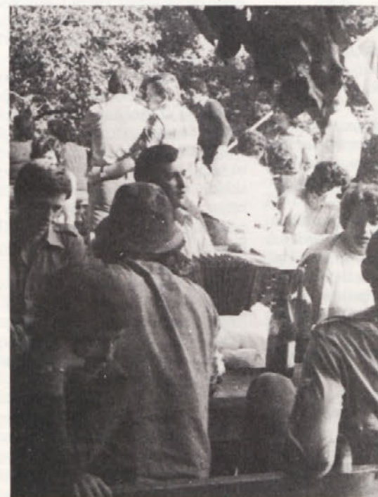
Naš Kurir se spozna tudi na tipke „frajtonarice“...