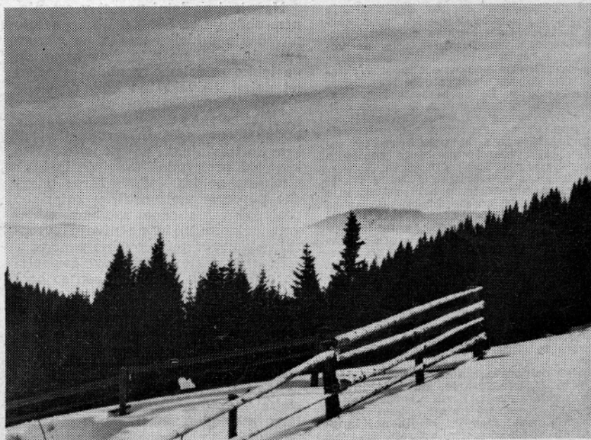
Mozirska planina iz drugega zornega kota. Tudi na območju od stare planske kočice proti Smrekovcu so lepi smučarski tereni