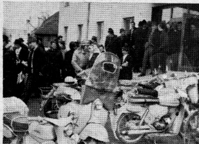
Udeleženci kmetijskega predavanja ob zaključku nasmejanih obrazov zapuščajo poslopje SO

minarskih predavanjih. Dokončno oceno bomo lahko izoblikovali šele kasneje, ko bodo vidni rezultati v smotrnejšem gospodarjenju, večji prireji in smeļjšemu zamahu vključevanja kmetij v tržno-blagovno proizvodnjo in turistično gospodarstvo.