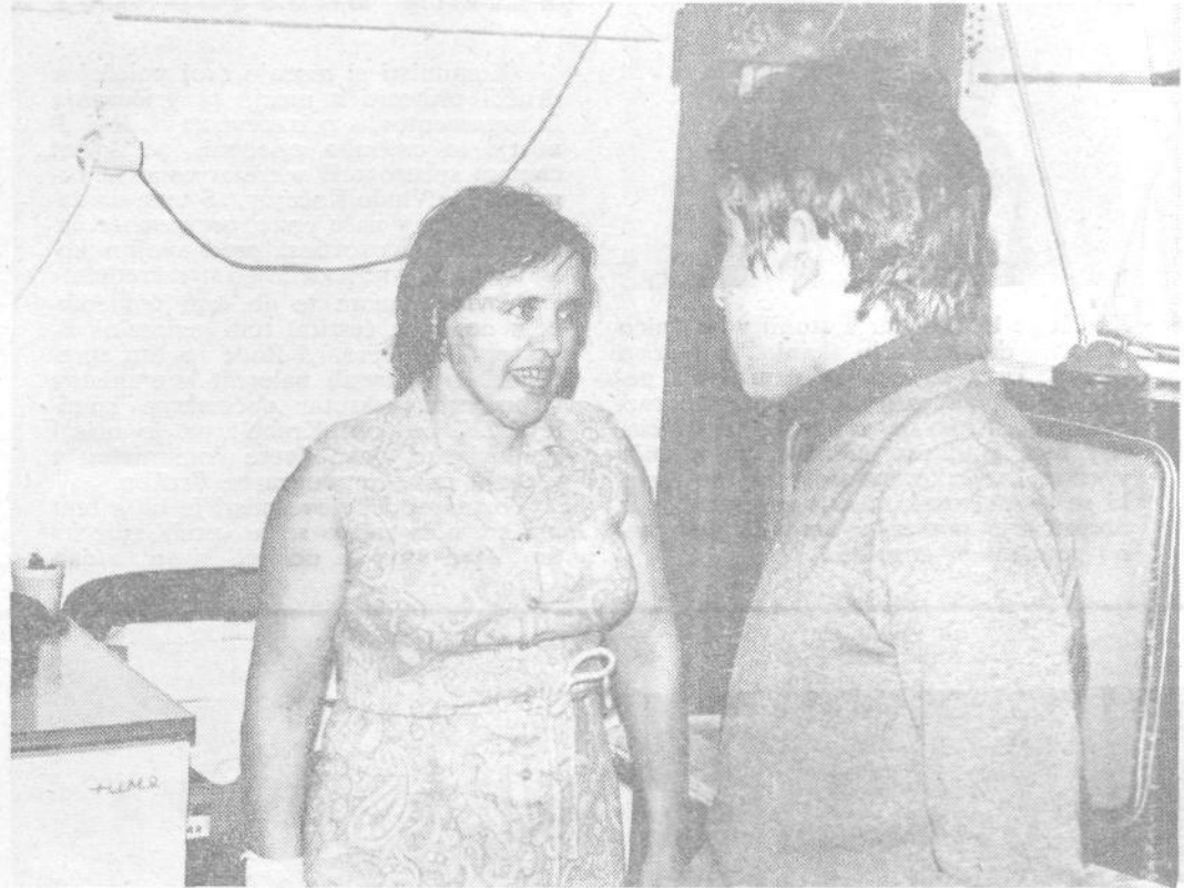
Mama ne skrbi, vse se bo dobro končalo, samo da porastem

V kotu sobe sem že prej opazil lep, bleščeč aparat, pod oknom pa pralni stroj.