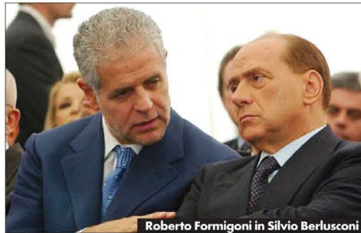
Roberto Formigoni in Silvio Berlusconi

nih predpisov rešiti zaplete z listami Ljudstva svobode, ker omenjeni odlok ne spoštuje deželne pristojnosti na področju deželne volilne zakonodaje. Po mnenju deželnega odbora Lacija bi ustavno sodišče utegnulo v kratkem zamrzniti vladni odlok, dokončno razsodbo pa naj bi izreklo po volitvah. V primeru ugodnega izida te razsodbe bi lahko prišlo do razveljavitve samih volitev. Že iz tega lahko bralci razberejo, kakšna zmeda in negotovost vladata v zvezi z deželnimi volitvami konec tega meseca. Zaradi navedenih zapletov v zvezi s predstavitevijo list Ljudstva svobode v Laciju in Lombardiji se je močno zakasnila volilna kampanja. Ko to pišemo, strankam ostajata za to pičila