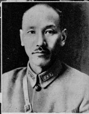
Maršal Čangkajšek, organizator kitajskega odpora proti Japoncem.

Zgoraj na desni: Japonski cesar Hirohito, čigar armade so brez vojne napovedi navalile na desorganizirano Kitajsko.