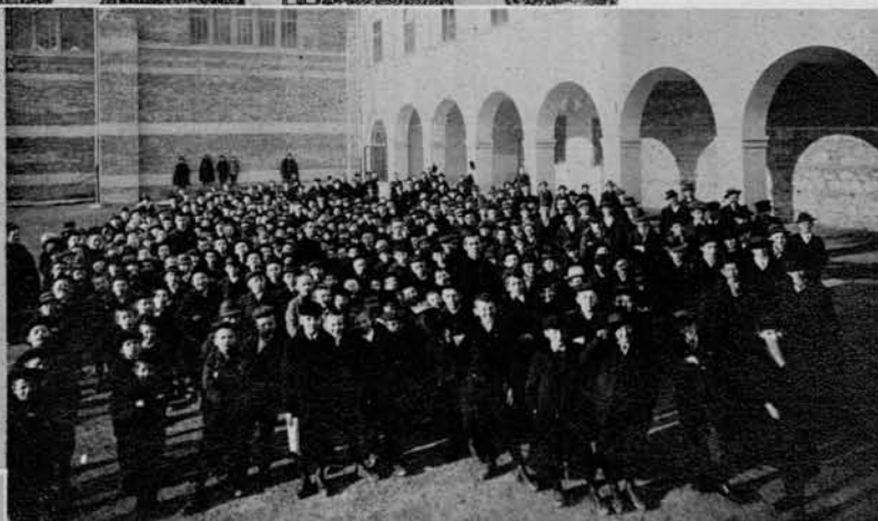
Zgoraj na levi:

Bl. Janez Bosko (1815-1888) ustanovitelj salezijanske družbe in hčera Marije pomočnice.