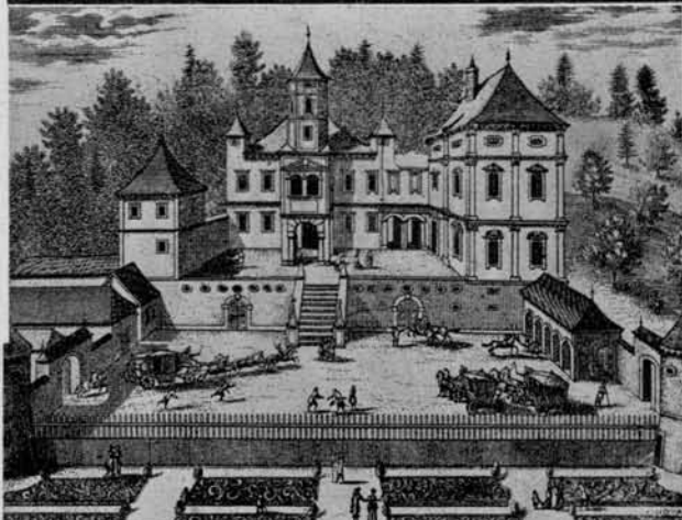
Na levi: Rakovnik za časa Valvazorja (v XVI. stol.).

Spodaj: Vsakonedeljski gostje (oratorijanci) salezijancev na Rakovniku, mladina se tu pod nadzorstvom igra in vadi v petju, glasbi, igranju itd.