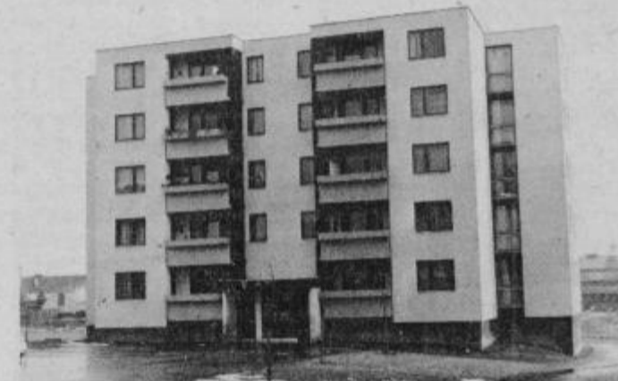
Stanovanjski blok AGISA ob Potrčevi cesti v Ptuj.

Potrebe in želje delavcev v tem kolektivu so seveda velike, le sredstev je vedno premalo, je dejal tovariš Klarič.