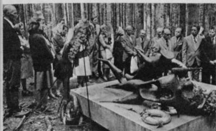
Spomenik pri Treh žeblikih, na mestu, kjer je bil svoj poslednji boj, kjer je do zadnjega borca izkrcaval legendarni Pohorski bataljon