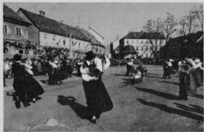
Z lanskoletnega nastopa folklornih skupin na ploščadi ptujške tržnice

Pripravljalni odbor tudi letos pripravlja potrebno propagandno akcijo prek dnevnega tiska, radijskih oddaj in nastopov posa-