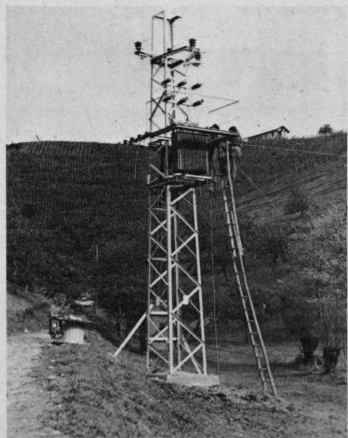
Nova transformatorska postaja v Gradišču (KS Cirkulane)