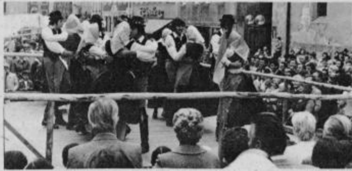
Nastop folklorne skupine iz Cirkovc v Weissenburgu