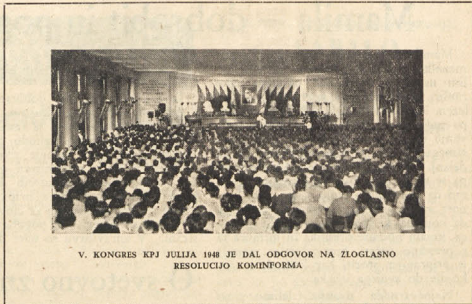
V. KONGRES KPJ JULIJA 1948 JE DAL ODGOVOR NA ZLOGLASNO RESOLUCIJO KOMINFORMA

smo do 1948 gledali na ZSSR s tako vero in ljubeznijo. Mi se ne sramujemo teh naših iluzij, narobe, ponosni smo nanje. Bile so pozitivna stvar in kazale so našo globoko vero v napredek in socializem. In v junijskih dneh 1948, ko jih je Stalin tako neusmiljeno, tako brutalno poteptal, nam je bilo to neznansko težko, vendar pa ni-