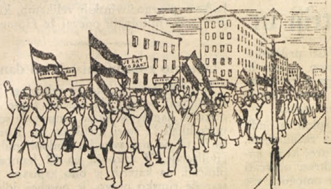
„BOLJE RAT NEGO PAKT“ SO VZKLIKALE LJUDSKE MNOŽICE DNE 27. MARČA 1941 NA BEOGRAJSKIH ULICAH PO PRISTOPU KRALJEVSKE VLADE K HITLERJEVEMU „TROJNEMU PAKTU“...

Vinjete akademskega slikarja Franceta Miheliča: