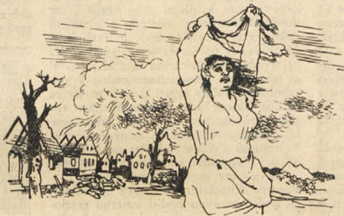
... DIVJA VOJSKA ZBESNELEGA OSVAJALCA JE NATO PUSTOŠILA PO DRŽAVI ...

Kako trdno je bilo v informbirojevskih krogih prepričanje, da bo Tito resolucijo Informbiroja utajil pred ljudstvom, priča tudi dejstvo, da je Duclos v »Humanite« še 5. julija napisal članek, v katerem obsoja Tita, da ne objavi resolucije Informbiroja v Jugoslaviji, marveč da jo z nasilnimi ukrepi skriva pred množicami: »Dejstvo, da jugoslovanski voditelji niso objavili resolucije Informbiroja, jasno govori, da si niso gotovi svoje argumentacije in da se boje predložiti ljudstvu resnico.« Jugoslovanski ambasador v Parizu Marko Ristić je takoj poslal Duclosu pismo v katerem ga je opozoril na neresnico, ki jo je navedel, ter mu celo priložil nekaj izvodov »Borbe«, toda Duclos seveda ni ničesar odgovoril na to. Prav tako tudi ni odgovoril na dejstvo, da odgovor KPJ na resolucijo Informbiroja ni bil objavljen niti v eni izmed vzhodno-evropskih dežel, ne v ZSSR, ne v Če-