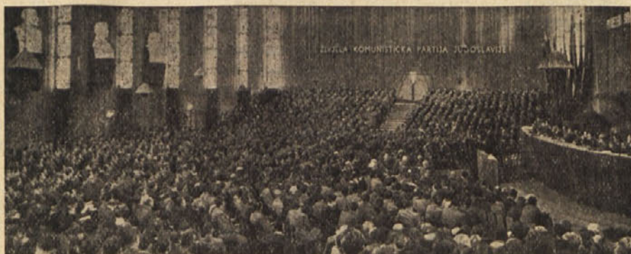
VI. KONGRES KPJ JESENI 1952 V ZAGREBU JE UGOTOVIL: ZASTAVA SOCIALIZMA JE REŠENA