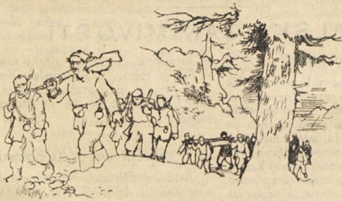
... V SVOBODNIH GOZDOVIH PA JE VSTALA DOMAČA PARTIZANSKA VOJSKA ...

Rusi, o tem, da velikanska večina naših ljudi ni izgubila perspektive v teh usodnih dneh leta 1948. Tovariš Tito je tedaj v neznanem pogovoru dejal tole: