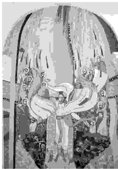
Oltar in detajl: Tema mozaika je Ezekijelova prerokba, da bodo mrtve kosti oživele. Tako je prikazana zgodovina zavoda, v kateri se iztrpljenja medvojnega in povojnega obdobja rojeva novo življenje.

pokazati toliko kosti. Poudaril je, da so kosti zaradi človeških slabosti, zaradi besed, ki jih povzročijo; iz njih ali po njih pa je tudi mogoče dvigniti se.