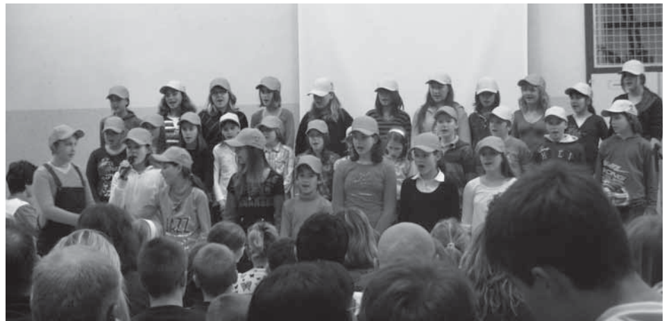
Šolski pevski zbor na Tribuni idej