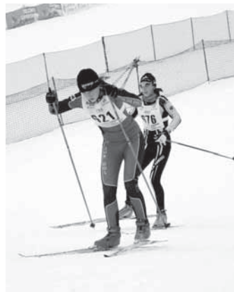
Ela na prizorišču Tour de ski in Trofeo Topolino

Smučarsko Skakalni klub MENCEŠ Zavrti 2, p.p. 17, 1234 MENCEŠ