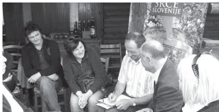
Predstavniki številnih društev so skupaj iskali možnosti povezovanja.

Dejstvo je, da je v Sloveniji preko 20.000 nevladnih organizacij, veliko večino predstavljajo društva, zraven pa so še ustanove in zasebni zavodi. Glavna razlika v delovanju nevladnih organizacij v Sloveniji in drugih evropskih državah je v tem, da se večino dela, ki se opravlja znotraj društev, ustanov in zavodov, opravlja brezplačno. Zaposlenih je izredno malo, velika večina tistih, ki delujejo v nevladnih organizacijah, to delo opravlja poleg svojega rednega dela, mladina to delo opravlja prostovoljno, aktivni pa so starejši upokojenci, ki imajo čas in najdejo v organizacijah svoje hobije. Regionalna stičišča želijo zato povečati stopnjo zaposljivosti v nevladnih organizacijah in pa posredovati, da je možnost tako za mlade kot starejše, da najdejo