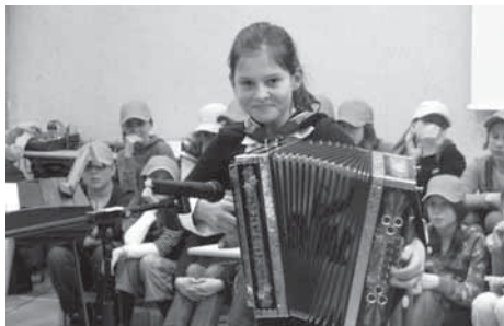
Mlada virtuozinja na hramoniki

Po kar nekoliko naporni in predolgi prireditvi (zaradi veliko predstavljenih idej), je napočil