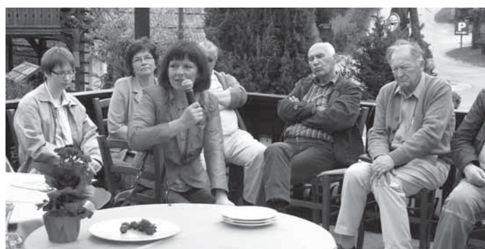
Udeleženci posveta se udeležujejo številnih delavnic in izobraževanj v sklopu regionalnega stičišča Srce me povezuje.

svojo zaposlitev in tudi gradijo kariero v nevladnih organizacijah. Največkrat se namreč dogaja, da prostovoljci delajo, ko so mladi in še študirajo, ko pa kader postane dober in izobražen, dobi izkušnje pa gre in dela v zasebnem sektorju, ker se enostavno to bolj izplača in ker je težko najti neka sredstva za zaposlitev v nevladni organizaciji. Tudi zaradi tega so nevladna regionalna stičišča nevladnih organizacij horizontalne mreže, da bi se povečala možnost zaposljivosti v nevladnem sektorju in da bi tem organizacijam pomagali pokazati neko pot do sredstev, ki so na voljo. Po analizi, ki je bila opravljena, največ sredstev za financiranje teh organizacij prihaja iz občin, nekaj manj s strani države in še manj s strani EU.