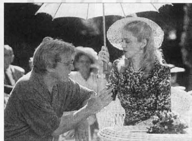
Alan Parker z Evito

Novo leto je prineslo tudi na platna italijanskih kinematografskih dvoran pričakovani film režiserjev Alana Parkerja in Oliverja Stonea (slednji je s Parkerjem podpisal filmov scenarij) Evita z ameriško pop pevko Madonno v glavni vlogi Eve Duarte Peron, žene nekdanjega argentinskega predsednika. Film je pred kratkim prejel nekaj zlatih globusov, ki jih tuji dopisniki vsako leto podeljujejo v Hollywoodu.