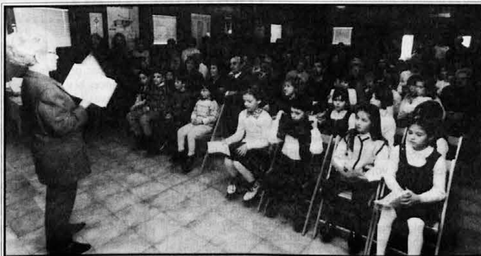
Številno občinstvo na Prešernovi proslavi v Barkovljah

Torej res kulturno razgiban in bogat teden v Barkovljah.