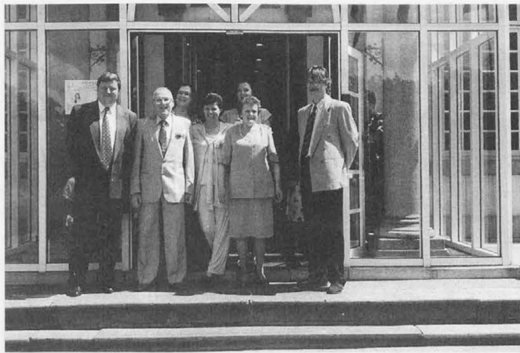
Za tako veselo parložnost ni mogla parmanjkat spominska slika z družino