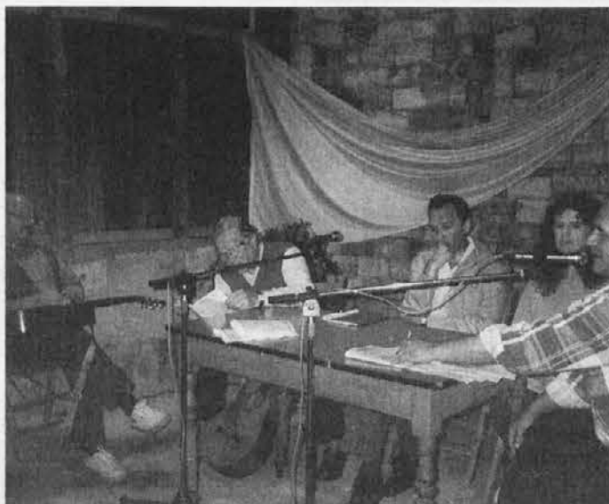
An moment večera na Zverince