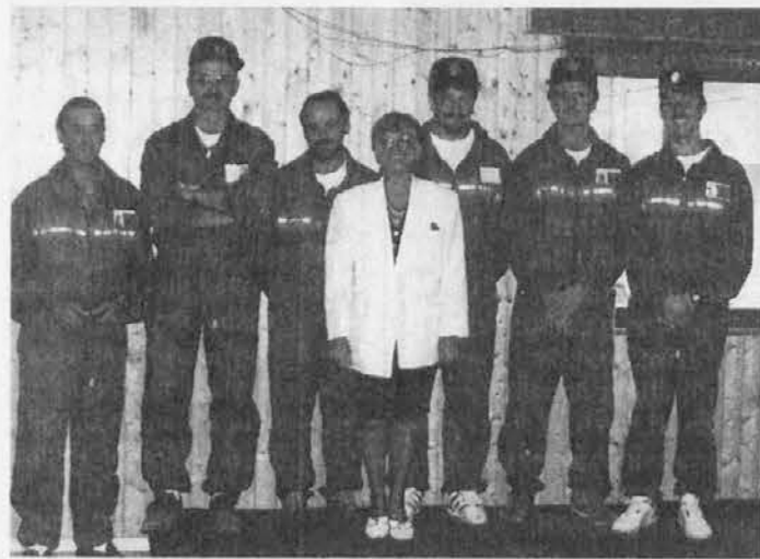
Zupanja Filippig z nagrajenimi člani civilne zaščite

Dezela je pozabila na gorate predele in doslej ni nič konkretnega storila v korist gozdnega gospodarstva. Tako je bilo slisati prejšnjo nedeljo v Tipani na posvetu o gospodarskih perspektivah v Julijskih Predalпах, ki sta ga pripravila tipanska občinska uprava in gorska skupnost za Terske doline.