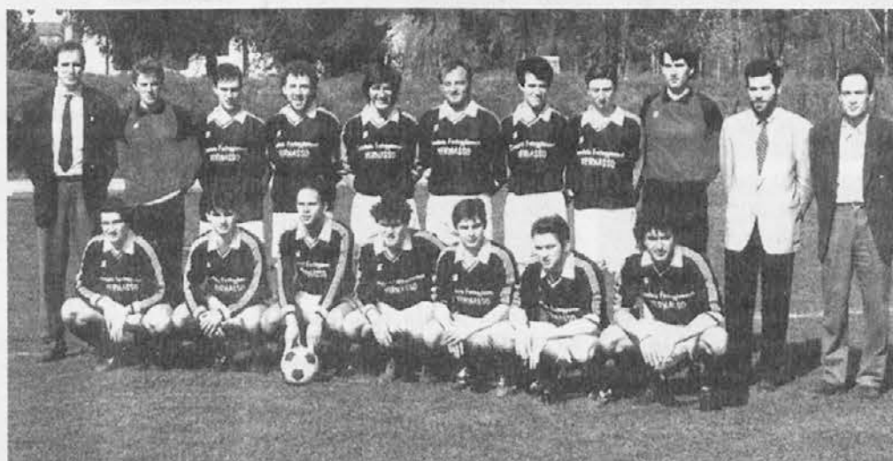
La rosa della prima squadra che ha preso parte al campionato 93-94