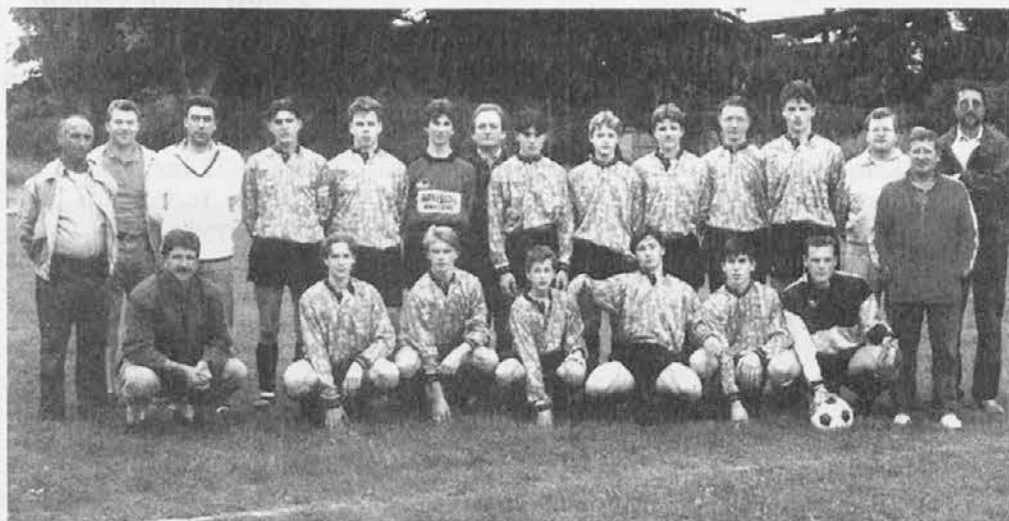
La formazione degli Allievi della Valnatisone nell'annata 1992-93