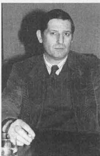
Sen. Darko Bratina

Slovenski senator Darko Bratina je kot prvi podpisnik vložil v senat zakonski predlog za zaščito slovenske manjšine v Italiji. Gre za besedilo, ki je izraz celovitosti naše manjšine, saj so ga sestavili predstavniki zamejske politične in civilne družbe (besedilo so sestavile slovenske komisije DSL, SKP, Demokratskega foruma, SSK, SKGZ, SSO in organizacije Slovencev iz videmske pokrajine).