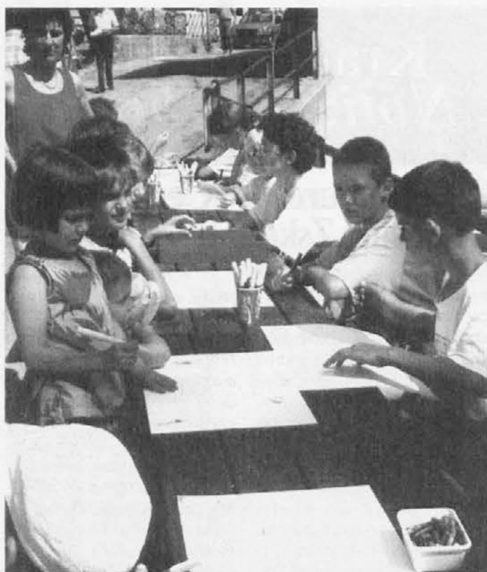
V Matajurju se je zbralo veliko mladih umetnikov

“Slovenija s posebno pozornostjo sledi stvarnosti Slovencev na Videmskem in je ob vsakem trenutku pripravljena pomagati, ker se dobro zaveda nezavidljivega položaja, v katerem ta skupnost živi”. Tako je povedal predsednik slovenskega parlamenta Jožef Školč, ki se je udeležil tradicionalnega Srečanja Slovencev, ki sta ga že četrta v vasici na obronkih beneškega očaka pripravila Zveza Slovencev ob sodelovanju Planinske družine Benečije. Dvodnevni praznik je povsem dosegel svoj namen. Obnovil se je duh Kamenice, obnovila se je tradicija, obnovilo se