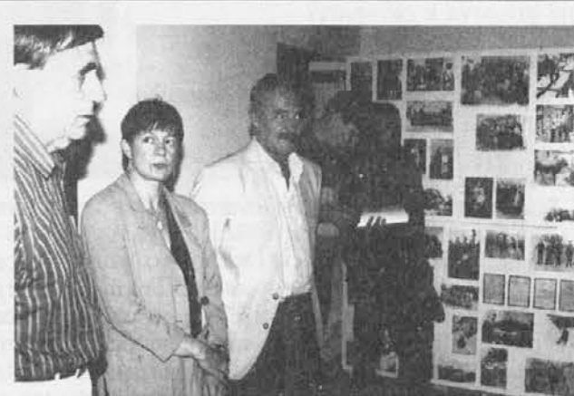
Resta aperta fino al 27 agosto (orario 10-12 e 17-19) la mostra fotografica "Benecia tra guerra e pace" presso il Centro civico di Cividale. Nella foto un momento dell'inaugurazione della stessa mostra a Montemaggiore