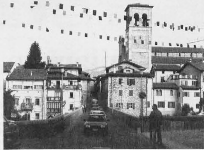
Cividale in festa con il Torneo dei borghi

cividalesi degli anni '60. Domenica verrà assegnato il palio per borghi e frazioni mentre lunedì si svolgeranno le finali dei tornei sportivi e sarà proclamato il borgo vincitore.