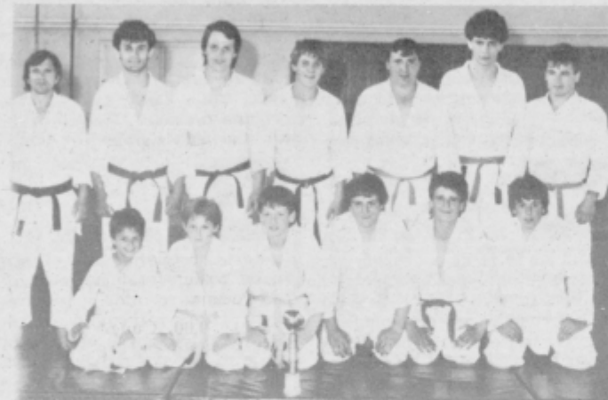
Zmagoviti gorišniški judoisti.

doisti Impola iz Slovenske Bistrice, oba kluba iz Maribora, ekipa Celja, dve ekipi iz Ljubljane in drugi slovenski klubi, sodelovalo pa je tudi več ekip iz drugih republik; dve ekipi iz Zagreba, ekipa iz Sombora, Čakovca itd. Kot gost turnirja pa je pri mladincih sodelovala tudi ekipa iz