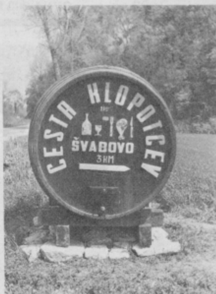
Na Švabovo in Gorco vabijo odsluženi sodi, nekaj pa jih čaka na odprtje vinarskega muzeja. V tozdu so jim namenili turistično poslanstvo.

V središču turističnih načrtov je sedaj Gorca. Za goste jo bodo odprli že s prvim jubilejem. Po štiriletnem zaprtju ji bo tozd vlil novo življenje.