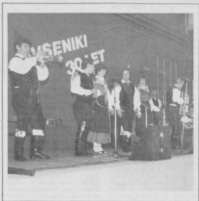
»Kako lepo je biti muzikant! Vedo dekleta, kdo je zanje pravi fant! Zagodilo zdaj, veseli muzikant, potegni še enkrat svoj stari škant! ...« igrajo in pojejo Avseniki v skladbi LEPO JE BITI MUZIKANT.

Ker pa je zaradi priljubljenosti melodij veliko povpraševanje po notnih zapisih, Vilko in Slavko Avsenik v samozaložbi izdajata note. Tako bodo stvari ostale in je material dostopen za vse ... Ker pa je veliko lepih posnetkov