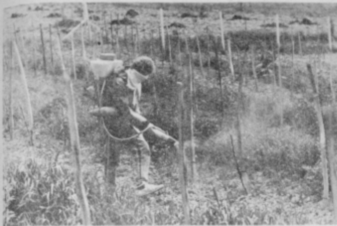
Učenci opravljajo vsa dela v šolskem vinogradu.