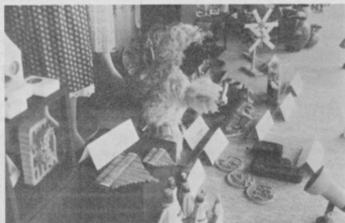
Spominki bodo na ogled do 25. junija.

Na večerjnjem otvoritvenem slovesnosti sta o pomenu spominkov za turistični razvoj občine in širšega prostora govorila pred-