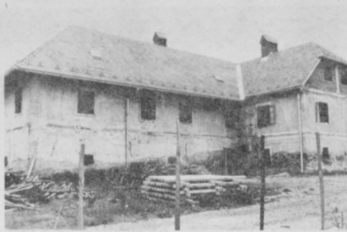
Šolski (v bližnji prihodnosti vzorčni) objekt na Grajenščaku.