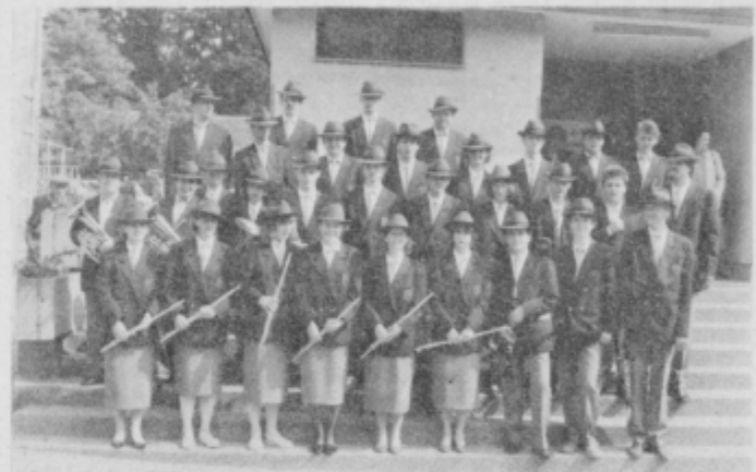
Domači godbeniki so se predstavili v novih, elegantnih uniformah.