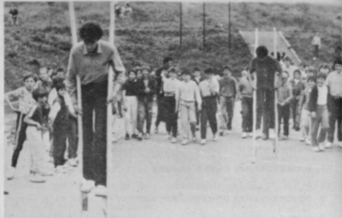
Veseli ob družabnih igrah.

Komite se je seznanil tudi z besedilom osnutka odloka o pripravi in sprejetju sprememb in dopolnitev dolgoročnega in srednjeročnega plana občine ter z navodilom o pošiljanju obvestil o cenah. MG