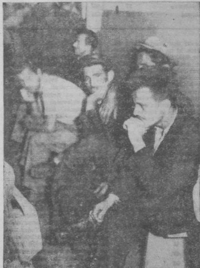
Vrsta čakajočih v zdravniški čakalnici doma za ljudsko zdravje v Beogradu