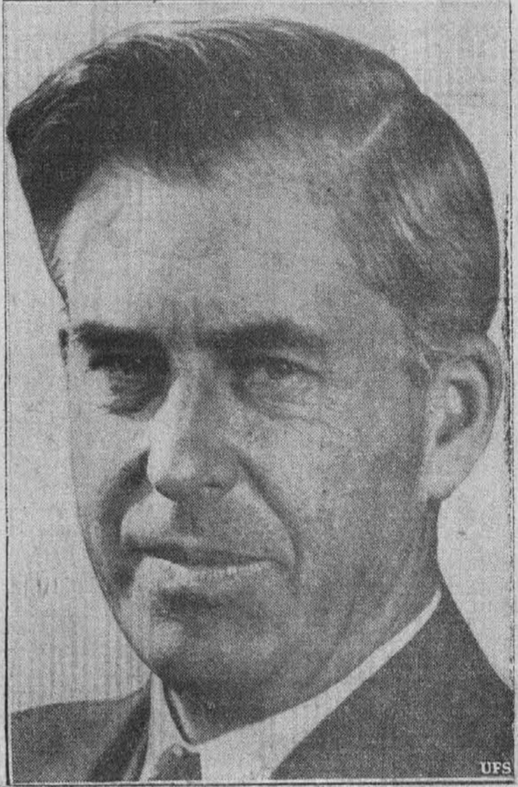
Podpredsednik Henry A. Wallace