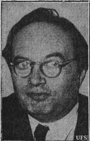
Sloveči pisatelj, Franz Werfel, je tudi pribežal v Ameriko iz Evrope, kjer je bil večkrat aretiran po nemški tajni policiji. Prišel je iz Čehoslovaške in upa postati ameriški državlján.

To navadno pojejo minoriti po kompletoriju. Brat Edvin jo je naučil tega slavošpeva na Mater Gospodovo v nočeh, ki jih je prebedela pri njem, ko je na smrt bolan ležal pri njih doma na Jorundgaardu. Splazila se je na cerkveni dvor, stala je z otrokom v naročju ob steni in tiho govorila predse ta spev.