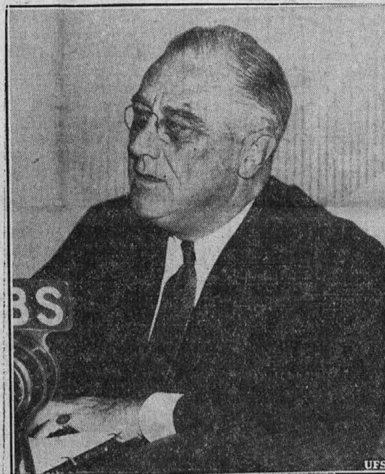
Slika nam kaže predsednika Roosevelta, ko je nagovoril ameriške fante in može, katere je sedaj zadela registracija za obvezno vojaško službo. Povedal je, da je temu vzrok — ohranitev demokracije.