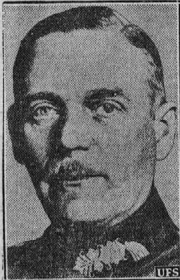
Vrhovno poveljstvo nad četami osišča v Afriki je prevzel nemški vrhovni poveljnik maršal Wilhelm Keitel, ki je nadomestil italijanskega poveljnika-maršala Graziani, s katerega po časnostjo so bili Nemci nezadovoljni.

Kristina se je znova vlekla k trgu navkreber, s krvavimi nogami, premočena in trudna. Prišla je do sive kamenite cerkvice — za njo je stalo nekaj s plotom ograjenih hiš. Naakve je tako grozno vokal, da ni mogla stopiti v cerkev. Toda slišala je petje skózi okno, ki so bila brez šip, in prepoznala antifono Laetare, Regina Coeli — veseli se, Kraljica nebes — kajti on, ki si ga nosila, je vstal, kakor je bil rekel. Aleluja!