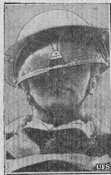
Kakor so nekoč vitezi imeli v bojnih igrah zagrnjene obraze s posebno kovinasto mrežo, prav tako v sedanji vojni nosijo angleški vojaki pokrivala, ki so opremljena s posebno pripravno mrežo, da se jo potegne na oči in se iste tako zavaruje pred drobci letedečega kamena in železa.

Spreletela jo je misel — koliko rajši bi prebila noč tukaj pri minoritih, s obratih brata Edvina. In tja v Bakke je bilo tako daleč — in bila je trudna, da bi kar omahnila. Tedaj je velel menih samostanskemu bratu, naj odvede ženo v žensko prenočišče — "in daj ji malo kolmeževga luga za noge, ranjene so, kakor vidim—"