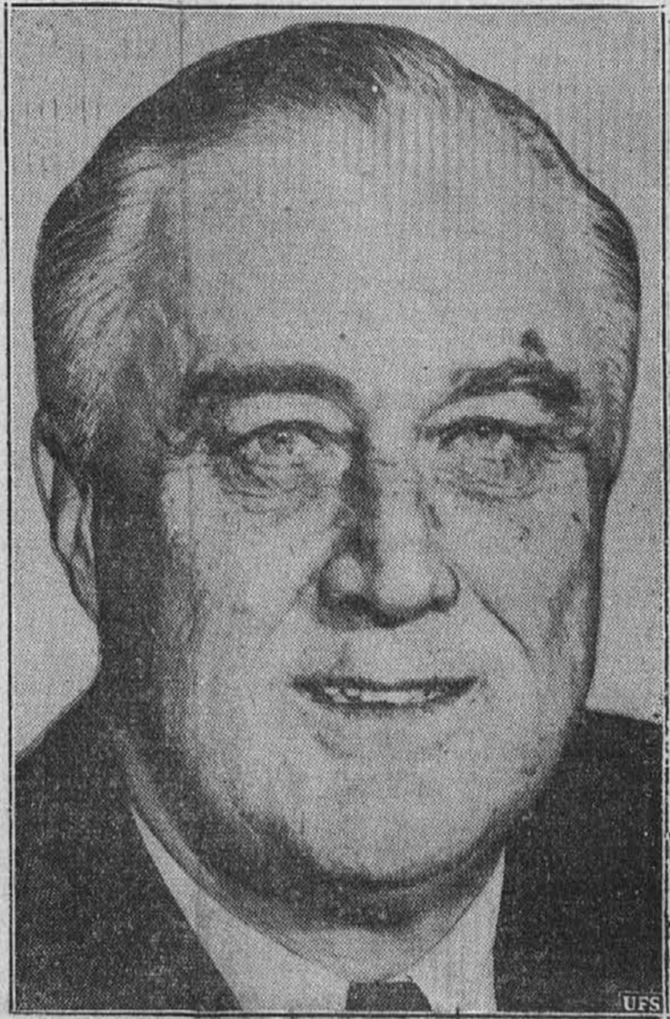
Predsednik Franklin D. Roosevelt