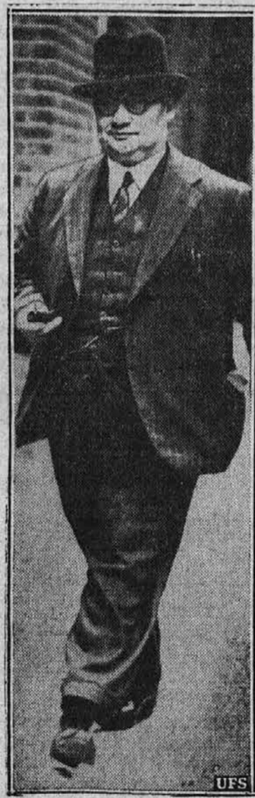
Ernest Bevin, socialistični minister dela in nov odločen mož v angleškem kabinetu je na poti na važno konferenco v Londonu.

KADAR potrebujete notarske listine ali notarski pečat.