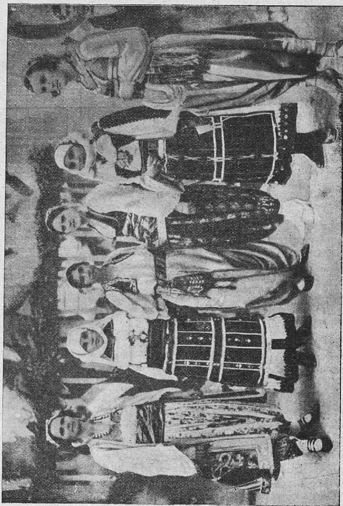
MAKEDONSKA NARODNA NOŠA IZ OKOLICE SKOPLJA. Makedonija je najjužnejša pokrajina Jugoslavije. Do l. 1913. je bila pod turškim gospodstvom, zato je tudi kulturno zaostala; ohranila si je ipa do danes starodavne narodne običaje. (Glej: „Iz naše skrinje.“) Slika predstavlja pravoslavne in mohamedanske Makedonke.