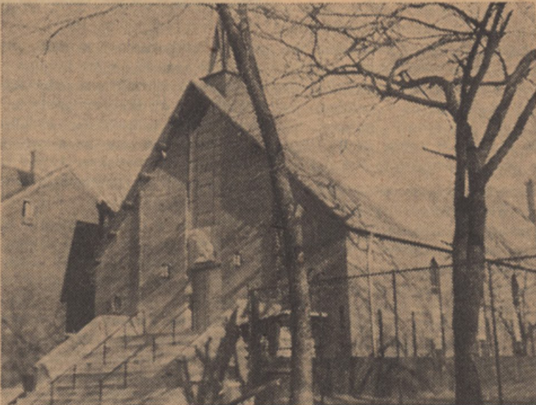
NOVA SLOVENSKA CERKEV MARIJE POMAGAJ V TORONTU, DAR TORONTSKIH SLOVENCEV MARIJI V MARIJINEM LETU 1954.

Prišli so hudi časi. Razmetani smo po svetu daleč drug od drugega. Še v slabših razmerah žive naši dragi v domovini. Njegov tolikokrat snidemo in povežemo v Mariji: Ob večerih kipi molitev