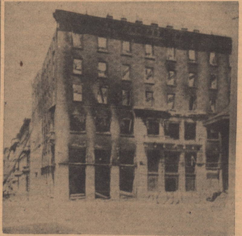
THE SLOVENIAN CULTURAL AND ECONOMICAL CENTRE „SLOVENIAN NATIONAL HOME“ (SLOVENSKI NARODNI DOM V TRSTU) IN TRIESTE, DESTROYED BY FIRE IN 1920 DURING THE ITALIAN ANTISLOVENEAN PERSECUTIONS.