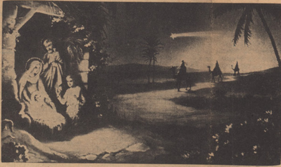
„LE DEVICA Z JOZEFOM TAM, V HLEVCU VARJE DETECE NAM“

Ker se je za zadnje številko nabralo preveč gradiva, je izostalo nekaj poročil o slovenskih prireditvah zadnjega časa. Ker je Slovenska država do neke mere tudi kulturna kronika življenja med Slovenci, prinašamo poročila v tej številki, čeprav so nekoliko pozna.