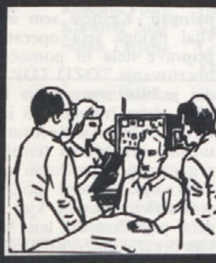
Zdaj boste morali strogo upoštevati dieto in jemati zdravila! Pri nas se oglasite čez leto, ko bomo naredili gastroskopijo.