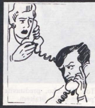
Nekaj mesecev kasneje... Moj mož bruha kri in zelo je bled... Najbolje bo, če ga takoj peljete v bolnišnico!