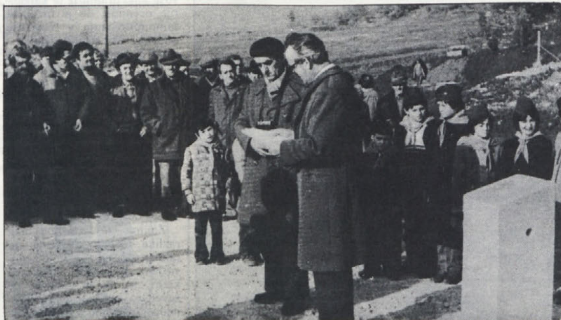
Slavnost v Radatovičih.