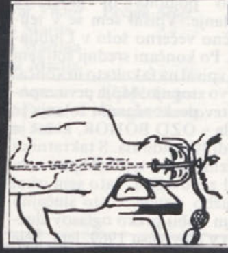
Cez eno leto: brazgotina se je dobro zarasla... Imate kakšne težave, predvsem spomladi in jeseni.