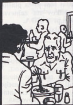
Vidim, da ti hrana ne tekne. Te morda boli želodec?

(temu rečemo tabletomanija), prekomerno uživamo alkohol itd. Vse to pa so vzroki, ki v nas porušijo ravnovesje, zaradi česar nas napade sila nevšečna bolezen: ulkus.