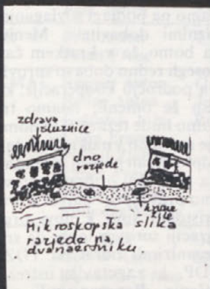
Razjede na dvanajsterniku nastanejo zaradi delovanja želodčne solne kisline in pepsina (beljakovine razkrajajočega encima).