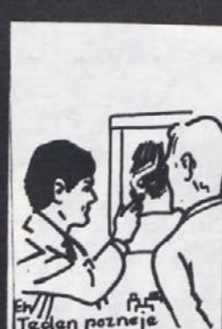
Res imate razjedo na dvanajsterniku.