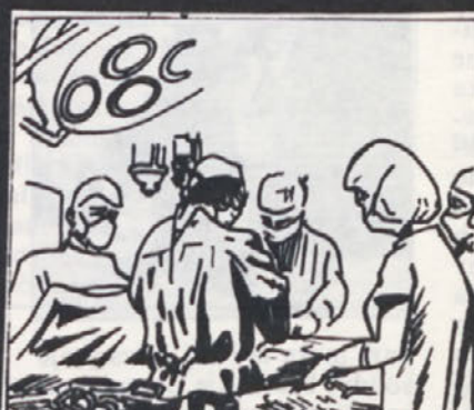
Krvavitev smo zaustavili, rano zašili. Izgubil je veliko krvi. Dajte mu transfuzijo...