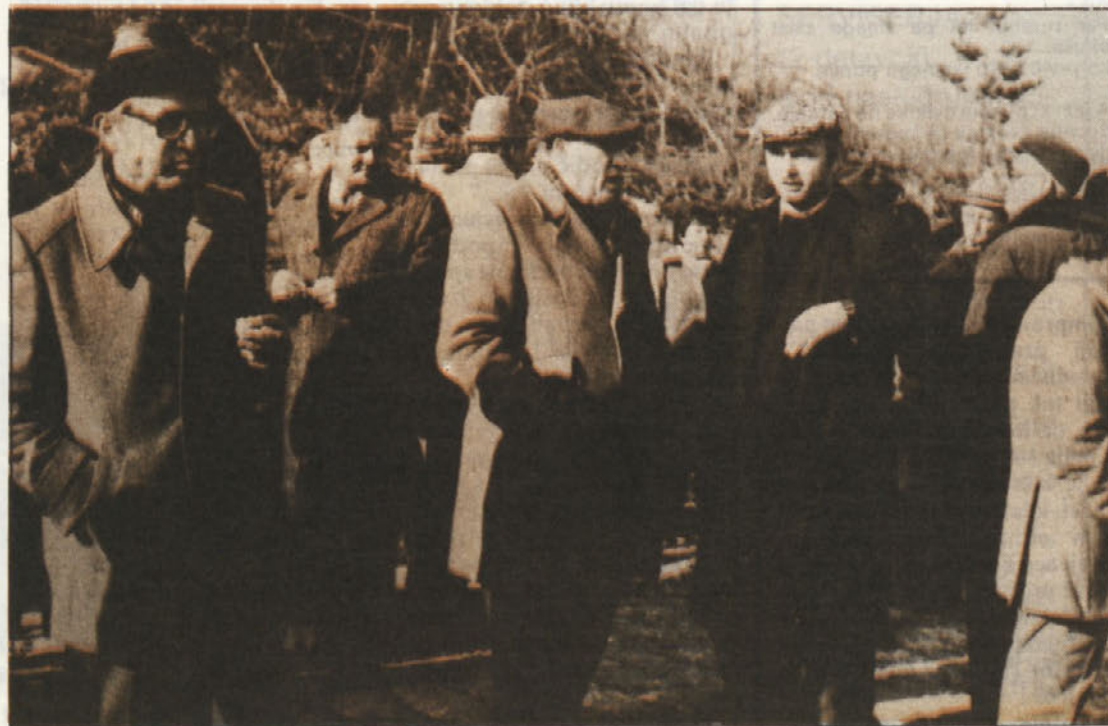
Pričakanje uresničitve želja in potreb v Radatovičih.