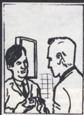
To ravnotežje motijo različni zunanji in notranji vplivi (škodila). Dal vam bom zdravila in navodila za dietno prehrano.