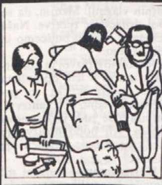
Prišlo je do perforacije krvavitve in šoka... Pripravite ga.