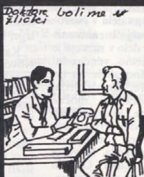
Doktor, krče imam v žlički... Tako hude, kot bi me rezali z nožem.