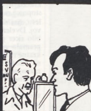
Boli me predvsem na prazen želodec, ponoči in proti jutru. Lezite, da vas pregledam!