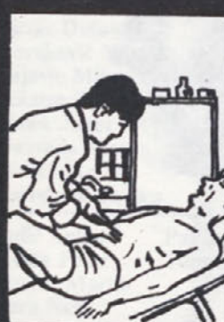
Bolečine ponehajo, če kaj malega pojem. Kaže, da imate razjedo na dvanajsterniku. Pošljem vas še na rentgen.