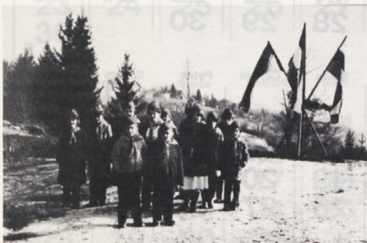
Pionirska straža ob polaganju temeljnega kamna za izgradnjo novega obrata KERAKRIL v Radatovičih.