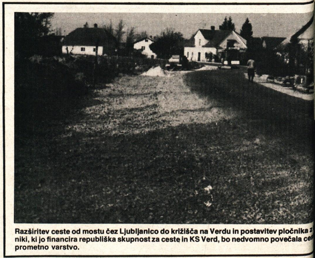
Razširitev ceste od mostu čez Ljubljano do križišča na Verdu in postavitve pločnika z niki, ki jo financira republiška skupnost za ceste in KS Verd, bo nedvomno povečala cestno prometno varstvo.