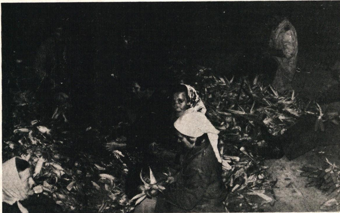
Pridnih rok pri ličkanju ni nikoli dovolj.