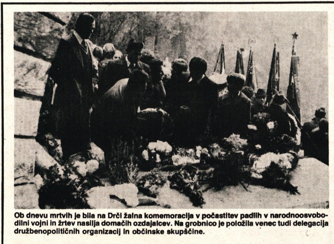
Ob dnevu mrtvih je bila na Drči žalna komemoracija v počastitev padlih v narodnoosvobodilni vojni in žrtev nasilja domačih ozdajalcev. Na grobnico je položila venec tudi delegacija družbenopolitičnih organizacij in občinske skupščine.