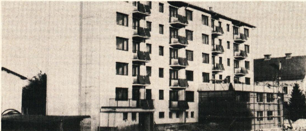
Na Vrhniki je zrasel stanovanjsko poslovni objekt S-7 z 32 stanovanji.

SAMOUPRAVNA STANOVANJSKA SKUPNOST VRHNİKA Izvršilni odbor