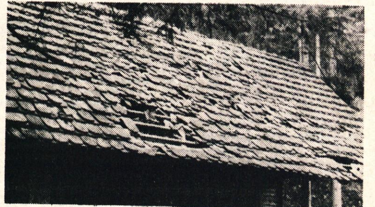
Da, takšna je streha na brunarici v Starem mlinu

Ob letošnji 200-letnici prvega pristopa na Triglav smo se Vrhničani že petič peš podali z Vrhnik na Triglav.