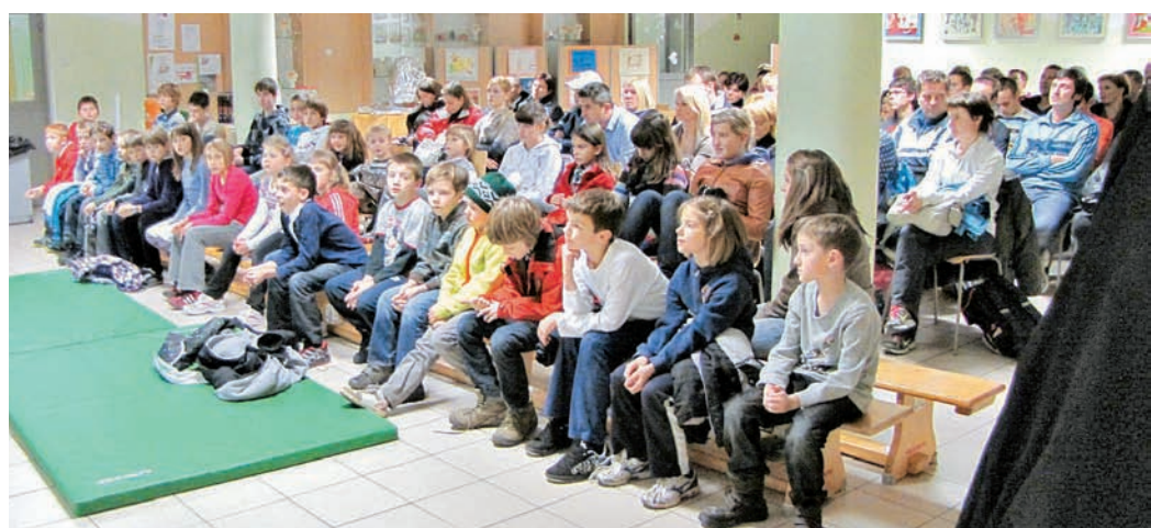
Gorski tekači KGT Papež so se v velikem številu udeležili zaključnega zboru s podelitvijo priznanj najboljšim v letošnji sezoni. Vsa tekača je prejel tekaški koledar, kapo, nogavice in trak.