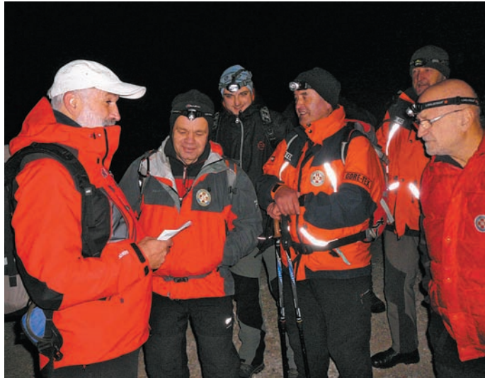
Preverjanje vnesenih podatkov na napravi GPS pred odhodom.

V četrtek, 1. decembra, je bila v gasilskem domu v Kamniku teoretična priprava, v petek, 2. decembra, pa je šlo zares. Na Rakovih ravneh, kjer so se zbrali, je močno pihalo. Tu pa tam se je pokazal prvi krajec, ki so ga hitro prekrili oblaki in Veliko planino je ovila gosta megla - torej idealne razmere za vajo. Udeleženci so se razdelili v šest skupin, ki so morale po dveh različnih smereh, ob izvrševanju določenih nalog priti na končni cilj, ki je bil v gostišču Zeleni rob na Traticah. Med vajo se je pokazalo kako koristna je satelitska navigacijska naprava, saj bi večina udeležencev brez njene pravilne uporabe zelo težko prišla v določenem času na cilj. Na vaji je bilo 37 udeležencev in dva lavinska psa. Poleg članov GRS so sodelovali tudi policisti in gasilci PGD Kamnik, PGD Kamniška Bistrica in PGD Nevlje, saj med njihove naloge spada tudi iskanje pogrešanih v manj zahtevnem svetu.