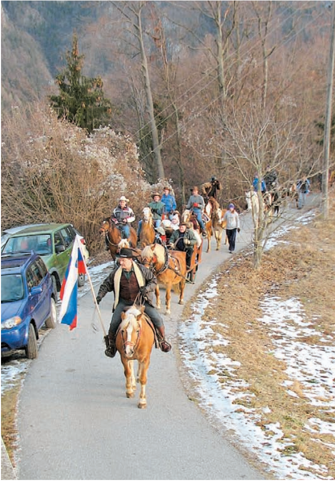
Povorka konj proti cerkvi sv. Ane na Gozdu, kjer je prvič potekalo žegnanje konj.

za nekatere pa tudi vir preživetja. V tem obdobju je bila dolina zelo razvita v gospodarskem smislu in v smislu