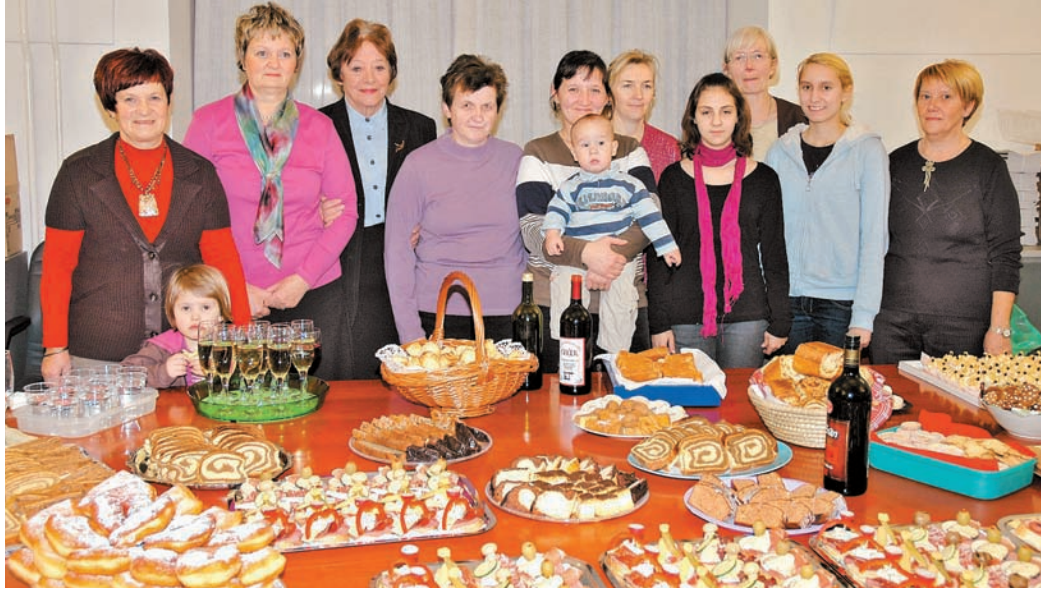
Neveljske klekljarice so s klekljanjem v okviru društva začele konec leta 2006 kot neveljska sekcija klekljarskega društva Čebulice Moste, od marca 2011 pa ustvarjajo v samostojnem društvu, imenovanem Veronike. Neveljske Veronike pa niso le ustvarjalne, spretno in marljive klekljarice, temveč tudi odlične gospodinje in gostiteljice, saj so obiskovalce odprta razstava v občinski hiši pogostile s slastnimi domačimi dobrotami.