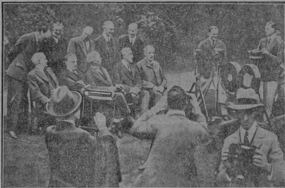
Zaprisega nove Macdonaldove angleške vlade v Londonu.

Človeška žrtev strele. Dne 4. septembra popoldne je šla 64letna vdova Marija Zicherl iz Srednjega Bitja pri Kranju k nad 100 m od hiše oddaljenemu kozolcu, da bi spravila pred bližajočim se nalivom pod streho vozove. Med popravljanjem je zadela strela starko, ki se je zgrudila mrtva. Strela je užgala na žrtvi še obleko, ki je zantila slamo v kozolcu. Kozolec, ki ni bil zadet od strele, je pričel goretu. Na po-