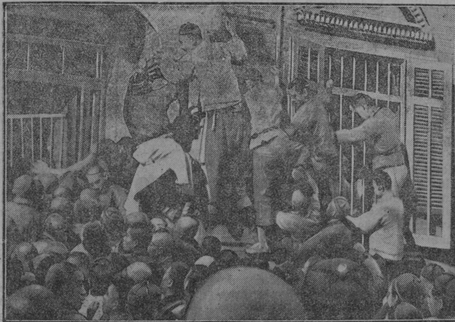
Vsled povodnji izstradani Kitajci udirajo nasilnim potom v skladišča za živila.