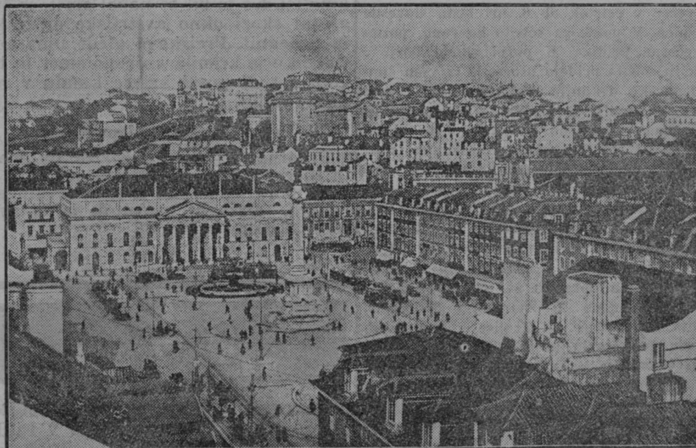
Glavno mesto Portugalske Lissabon, kjer je zatrla vlada 10 ur trajajočo vojaško vstajo.